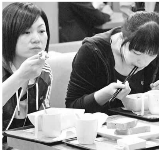
■立法會通過動議,促請政府推廣「慢食」文化,加強公眾教育,向公眾推廣慢食文化的理念和生活方式。資料圖片

香港文匯報訊(記者 鄭治祖)香港人一向講求快字,連吃飯也經常是匆匆解決,結果令許多人的身體變差。立法會昨日通過動議,促請政府推廣「慢食」文化,加強公眾教育,向公眾推廣慢食文化的理念和生活方式,以及教導學生在午膳時減慢進食速度等。食物及衛生局局長周一嶽回應時認同有關建議,指政府經常鼓勵市民改善飲食習慣,特別是在向學童推廣健康飲食方面一直不遺餘力,當局已通過「至『營』學校認證計劃」和「健康飲食校園」運動等計劃,協助學童自小養成及鞏固他們健康飲食習慣。