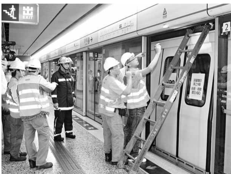
■港鐵事故頻生,民建聯進行民調發現,78%受訪者認為港鐵不應在6月按可加減機制加價。圖為去年油麻地港鐵站在上班繁忙時段發生罕見的架空電纜斷裂意外。資料圖片

民建聯於本月8至14日以電話隨機抽樣方式訪問了921名市民,結果發現,35.4%受訪者表示港鐵近年發生連串事故後,已影響他們對港鐵安全服務的信心。雖然有43.3%受訪者對港鐵處理事故安排上表示「滿意」,但仍