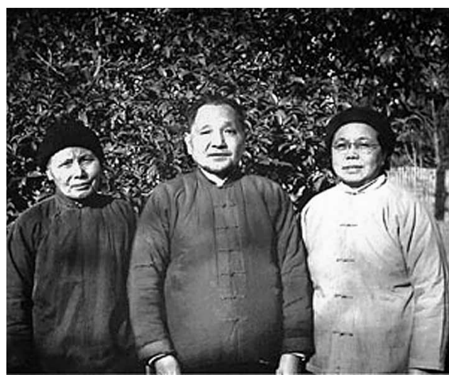
繼母夏伯根(左)與鄧小平夫婦。