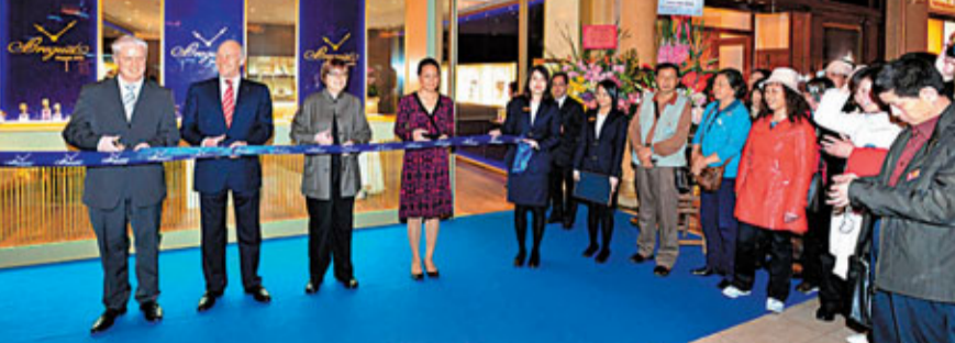
寶璣澳門專賣店於澳門威尼斯人度假村酒店開業

寶璣澳門威尼斯人專賣店日前正式開業，為顧客及鐘錶鑑賞家展示其始於1775年以來的獨特歷史與無懈可擊的製錶傳統。這家專賣店佔地136平方米，展示寶璣不同時計系列以及專賣店系列，單一樓層內的展櫃展示獨有的男士及女士珠寶系列。