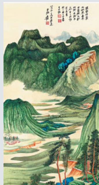
▲張大千《蜀山春曉》,是首度在拍賣市場中亮相,估價達2,000萬元。相片由蘇富比提供

▼齊白石的《金桂玉兔》,着意黑白相襯所生之色彩對比,畫中視覺效果強烈。相片由蘇富比提供