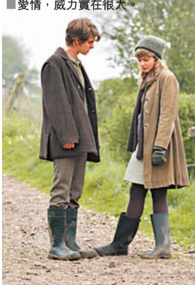
■愛情，威力實在很大。

「雖然故事關於複製人，但原著本身沒有太多科幻味道，較為平實，反而着重探討人性脆弱。故此，麥克也盡量保持原著精粹，避免加入太多科幻元素。」他表示，很多講述複製人的作品都是科幻電影。「導演背後講述的，都是企圖指控社會的權力。可是，我們的作品正好相反。主角們不逃避命運，因為他們從出生時，就被教導為自己的命運感到自豪和充滿責任感。」主角們「順服」的表現，是複製人電影少見。他們追求的，其實是抓緊時間去愛自己的愛人，因為生命短暫。