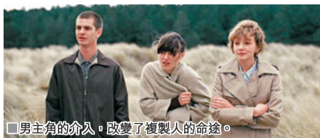
■男主角的介入，改變了複製人的命運。

觀眾不是複製人，其實也很難體會到其感受。「其實，這也是科幻片中裡頭的愛情故事。我希望呈現一種過時感覺，但同時又穿插一些幻想東西。」他表示，故事沒有強調發生的