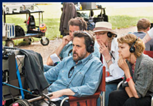
■導演努力拍好每個畫面。