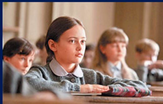
■從來沒想過，原來成長非為自己。