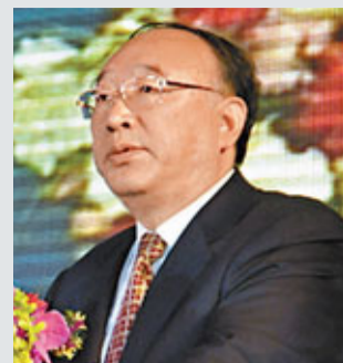
黃奇帆表示,重慶將成為信息產業的高端城市。

香港文匯報訊(記者 張蕊)中國首個物聯網產業示範基地14日在北京授牌,正式落戶重慶市南岸茶園新區。重慶市長黃奇帆指出,近年來重慶市打造了一大批物聯網示範項目,物聯網應用已經走在全國前列。