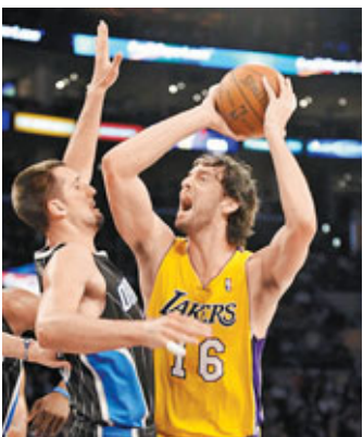
湖人隊加索爾(右)面對魔術隊安達臣的挑戰。

此役，奧蘭多魔術隊全場共出現18次失誤，是湖人隊的6倍。「魔獸」侯活得到全隊最高的22分和15個籃板，但有9次失誤。湖人「雙塔」加索爾和拜林分別有23分和10分進帳，拜林更是追平了個人職業生涯最高的18個籃板球。