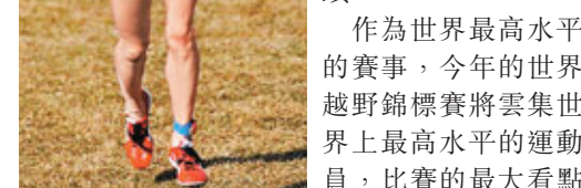
世界越野賽個人獎金達到3萬美元。

按照國際田聯的規定，每支隊伍可報名8人，比賽可以有6人出戰，計算其中最好的4人成績作為團體賽成績。作為世界最高水平的賽事，今年的世界越野錦標賽將雲集世界上最高水平的運動員，比賽的最大看點很可能是長跑強國肯尼亞和埃塞俄比亞之間的極限對決。