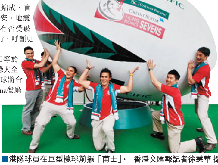
港隊球員在巨型欖球前擺「甫士」。

除振災外，港隊近日亦全力備戰下周賽事，更會與英格蘭等球隊進行友賽，本週六將公布港隊最後出戰陣容。