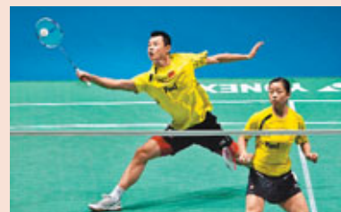
羽毛球項目賽制大變。