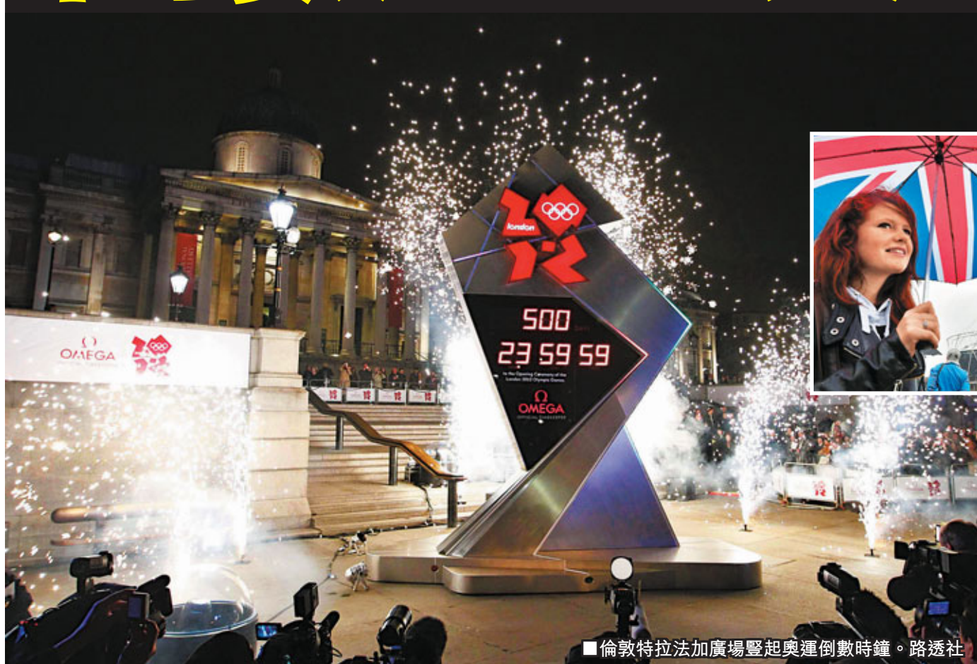
倫敦特拉法加廣場豎起奧運倒數計時鐘。