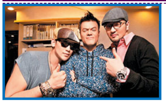
■Rain(左)和朴振英(中)齊為金泰宇(右)的新歌出力。

韓流巨星Rain(鄭智薰)和孫丹菲將出席本月18日至20日在泰國舉行的「2011年芭堤雅國際音樂節」。Rain將於19日登上戶外舞台，熱唱《Rainism》、《It's Raining》、《Hip Song》等多首大熱歌曲。