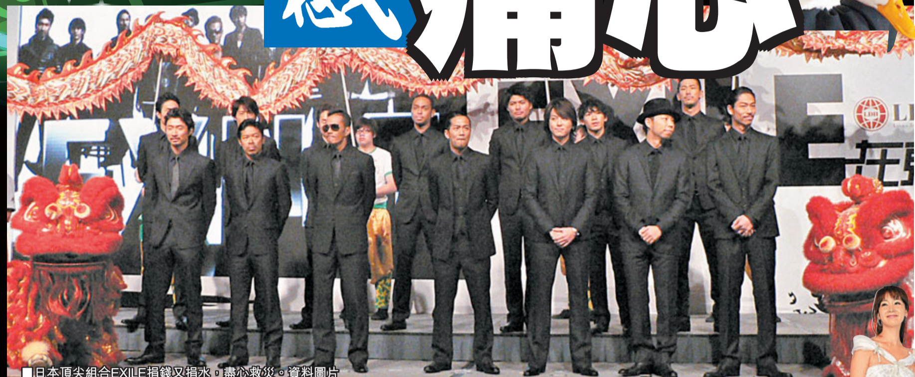
■日本頂尖組合EXILE捐錢又捐水，盡心救災。資料圖片