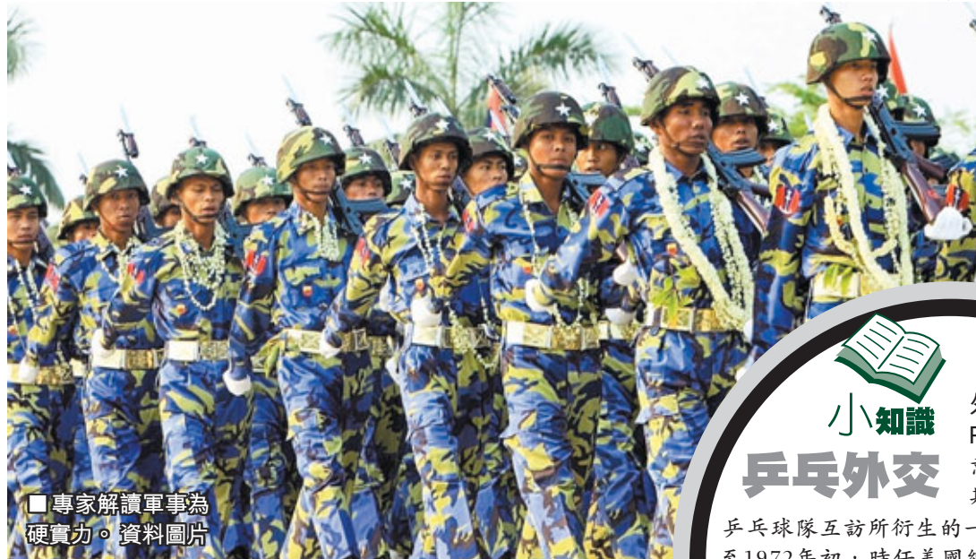
專家解讀軍事為硬實力。資料圖片

文化外交通常具有明確目標，一個國家政府以其支持的文化表現形式，開展公開活動。因此，文化外交不是單純的文化交往，一個國家若要與其他國家達到彼此了解和尊重，便需要影響別國社會對該國的認知和評價，還要影響別國對其的政策行為。