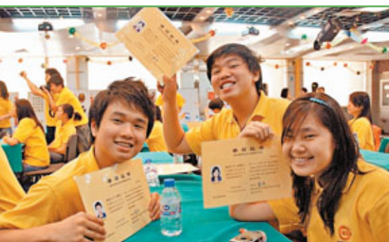
數十名菲律賓華裔學生遠赴中國參加夏令營，學習中華文化，獲益良多。資料圖片

最後，文化外交是一個國家形象的外在展示，而這取決於國民素質。至於國民素質的提高則有賴於每個國人的努力，也有賴於教育部門的工作。