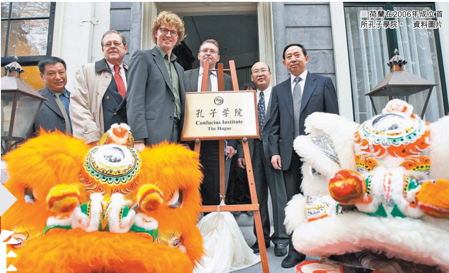
荷蘭在2006年成立首所孔子學院。資料圖片

香港浸會大學中國研究課程成立於1989年，至今已培養近兩千名本科生，為香港歷史最悠久的中國研究課程。香港文匯報與浸大中國研究課程合作推出通識專欄，以專業的角度，深入淺出地探究中國在社會民生、城市規劃、經濟轉型、外交政策等多方面的最新發展，為本港高中生提供具權威性的「現代中國」通識科單元學習材料。