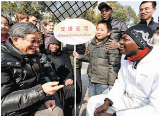
去年，上海舉行與外國人的雙語交流活動，作為迎接世博的前奏。

繼1988年7月和9月後，新中國首批駐外的中國文化中心分別在非洲的毛里求斯和貝寧建成並對外開放。2002至2008年，中國駐開羅、巴黎、首爾和柏林