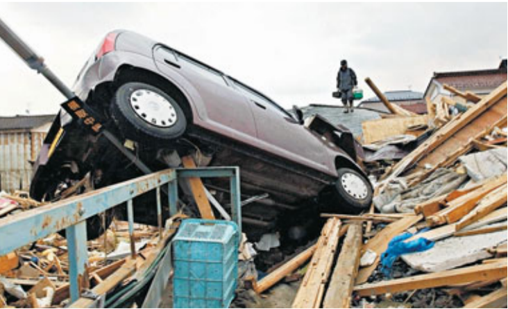
地震和海嘯造成嚴重的財產和人命損失，估計全球保險業賠償額將高達600億美元。

地震和海嘯造成嚴重的財產和人命損失，估計全球保險業賠償額將高達600億美元(約4,679億港元)，僅次於美國卡特里娜風災。三菱UFJ證券估計，若計算稅收損失、對災區企業補貼、停電導致的生產力損失等成本，日本重建費用將佔國內生產總值(GDP)的5%。美國白宮發言人卡尼表示，有信心日本可處理地震後的經濟挑戰，並稱地震不會阻礙全球經濟復甦。