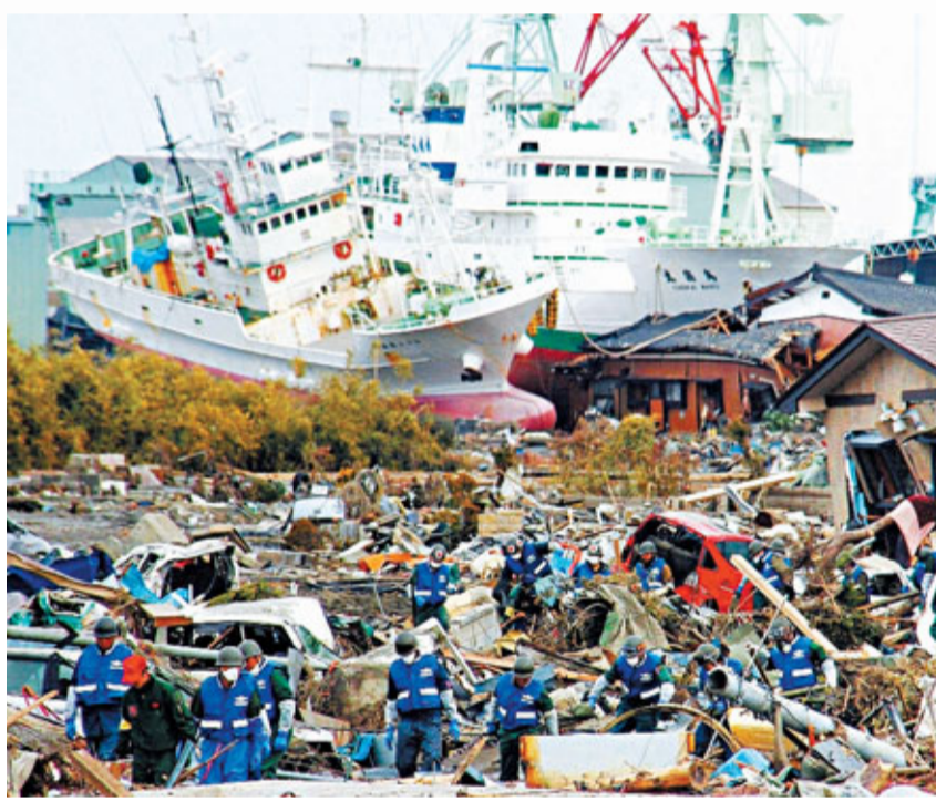
日本地震及海嘯後，核危機升級成另一憂慮，日後重建又是一個大考驗。

日本福島核電廠昨日再發生爆炸，東京輻射量一度超出正常水平20倍，觸發市場恐慌性拋售，日本股市繼前日挫逾6%後，昨日午市再暴瀉14.17%，收報8,605點，全日跌1,015點，跌幅達10.55%，是1987年股災以來最大雙日跌幅、史上第3大單日跌幅。此外，市場擔心日本核危機升級，危及全球經濟增長，歐美主要股市昨日全面下跌，美股早段曾急挫297點。