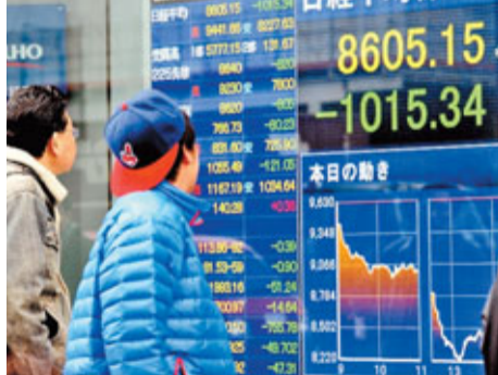
日經指數昨日曾跌逾14%，收市仍跌逾千點。

日本爆發核危機，嚴重衝擊一眾重工業股份，作為福島核電站部分反應堆的製造商，東芝首當其衝，股價前日已急跌16%，股份昨日停牌，但大量沽盤湧入，賣出價顯示股價再跌近20%。核能設備生產商日立和三菱重工，股價均跌逾8%。