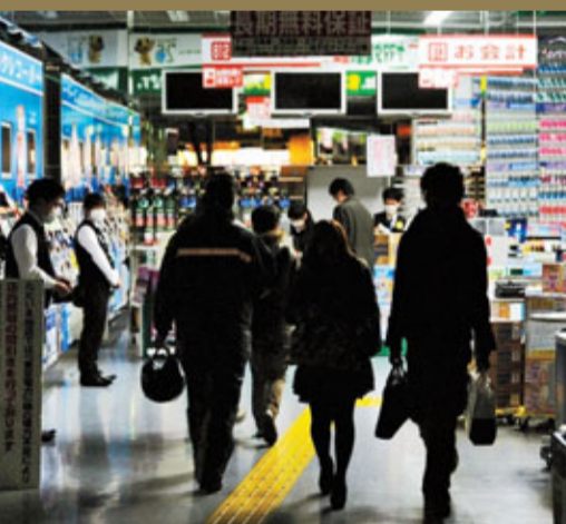
東京輪流停電，部分商店只有少量燈光，顯得人民心情更沉重。

日本在上世紀90年代初經濟蓬勃，但自1992年泡沫破後一沉不起，至今衰退期長達20年，經歷了2個「迷失10年」。一場大地震再重創日本經濟，迷失年代或會延續下去。