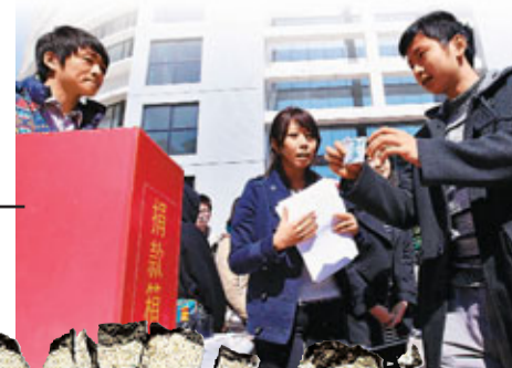
清華學生為日本災區捐款。