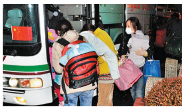
中國駐新潟總領事館組織14輛大巴從福島撤僑。

外交部領事司有關官員表示，在日本災區，如有港澳台同胞提出撤離意願，外交部將會安排一同撤離。這位官員稱，事實上，中國此前組織的一系列撤僑行動中，向港澳同胞提供同等撤離幫助，一直是外交部撤僑安排中的一項重要原則。