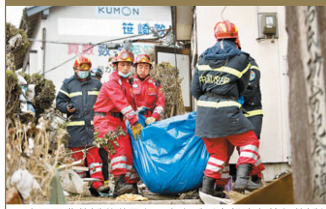
中國國際救援隊隊員在日本岩手縣大船渡市執行救援任務。

香港文匯報訊 據中國地震局15日消息，目前，中國國際救援隊正在日本大船渡市實施緊急救援行動。當地時間3月14日早上7點，救援隊分為3個小組立即開展排查行動，仔細排查了接到求救信息的地點，但目前尚未發現生命跡象。