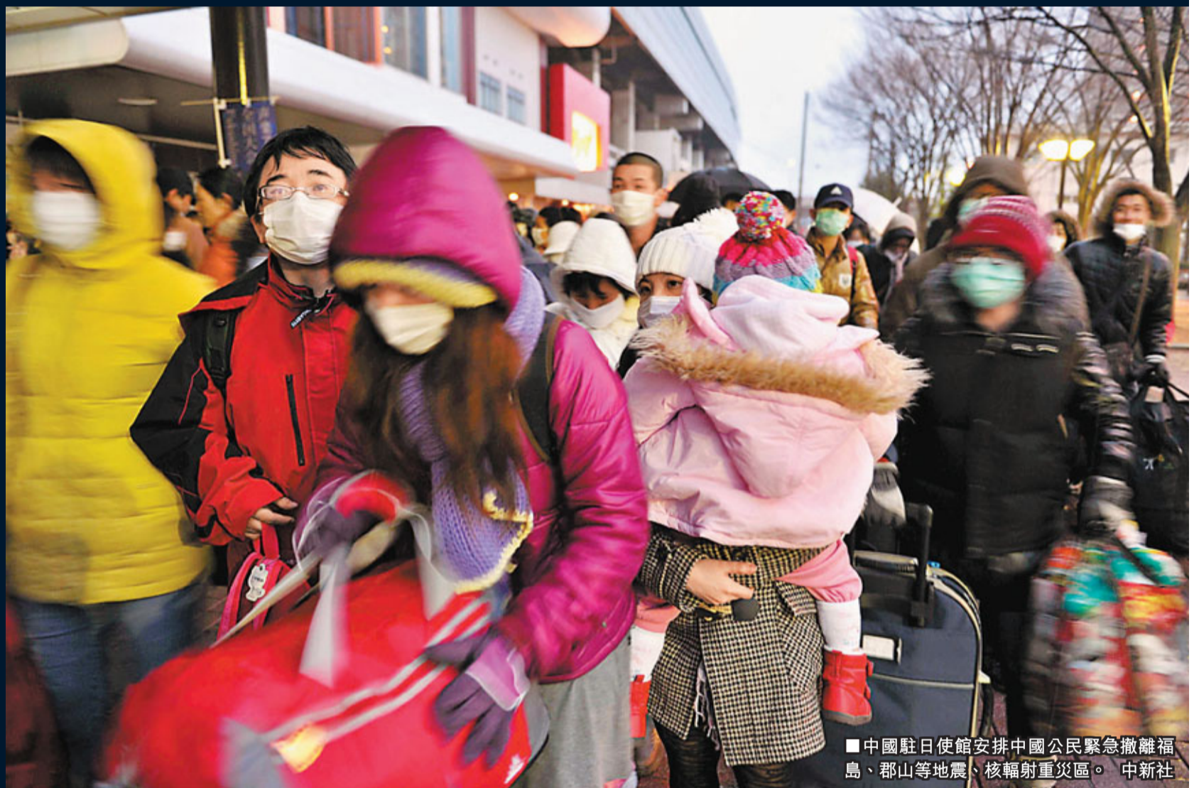
中國駐日使館安排中國公民緊急撤離福島、郡山等地震、核輻射重災區。 中新社

香港文匯報訊（記者 李理、葛沖 北京報導）日本9級地震所引發的核洩漏再升級，鑑於事態嚴重，中國駐日本大使館15日發佈緊急公告稱，將安排尚在重災區的中國公民有序撤離。國家有關部門正醞釀派包機或輪船赴日撤僑。外交部領事司有關官員向香港文匯報表示，身處災區的港澳台胞可一同撤離。在日本重災區4縣約有3.3萬中國公民，分佈廣且分散，聯繫非常困難，中國此次撤僑再度面臨嚴峻考驗。