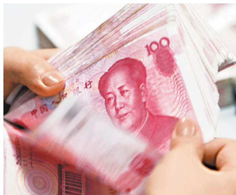
市場預期,央行再度加息或上調存款準備金率的可能性仍存。