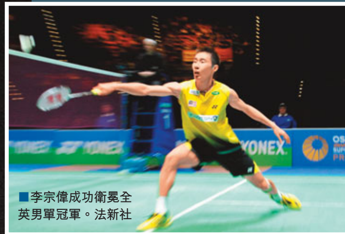
■李宗偉成功衛冕全英男單冠軍。