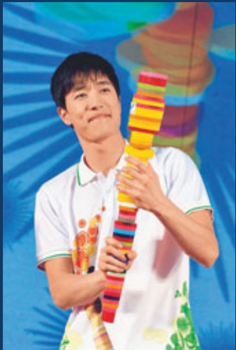
■劉翔任大運會火炬手全國選拔形象大使。 新華社

香港文匯報訊（記者 陳曉莉）中國110米欄飛人劉翔13日晚結束北京「兩會」後已轉飛抵深圳，應邀參加2011年深圳第26屆世界大學生夏季運動會（大運會）火炬手選拔啟動儀式。