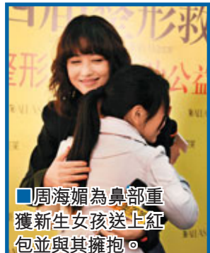
周海媚為鼻部重獲新生女孩送上紅包並與其擁抱。

在談及多年來美容的經驗時，周海媚認為最重要的是「心情好」：「我平時沒有用什麼特別的保養品，有時會運動一下，比如做瑜伽。我覺得保持美麗心情好重要。」周海媚亦表示，之前在拍《楊門女將》時受的傷傷很快恢復。「今年拍戲的日程差不多安排到了年底，將會接拍一部電影和一部電視劇。」她還坦言，由於比較忙，「今年將不會結婚。」