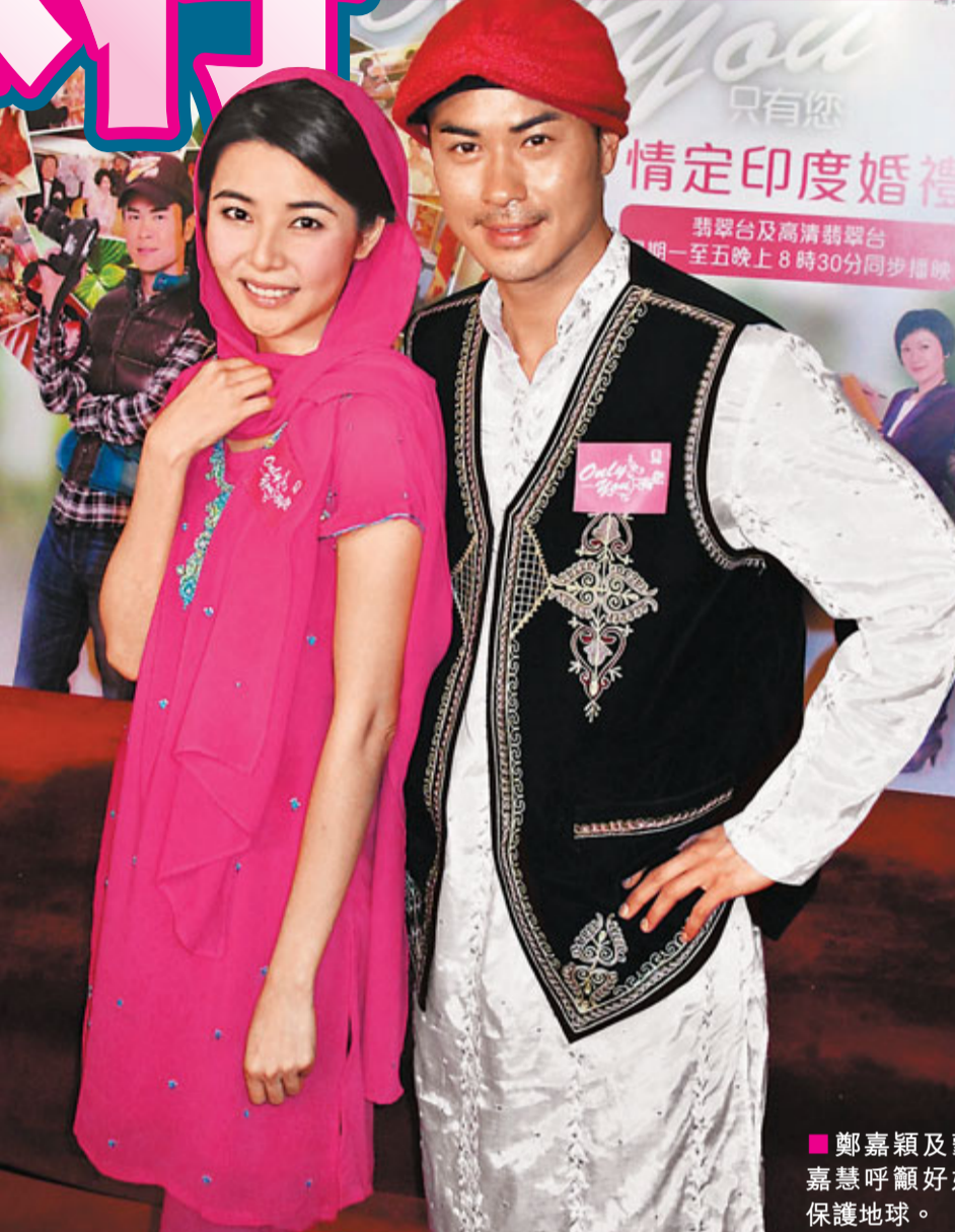
鄭嘉穎及蒙嘉慧呼籲好好保護地球。