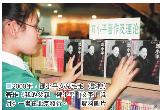
2000年，鄧小平女兒毛毛（鄧榕）著作《我的父親 鄧小平「文革」歲月》一書在北京發行。

目睹張帆的義舉，現場的遊客們對他豎起了大拇指，還有人不停地喊：「好小伙子，好樣的。」