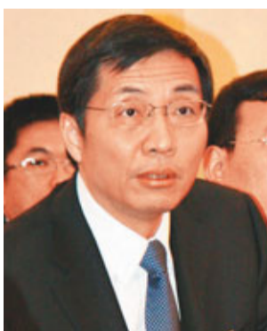
龍岩市委書記張健。

國務院總理溫家寶在政府工作報告中提到,中國已經全面建立起了新型農村合作醫療(簡稱「新農合」)保障制度,覆蓋全國8.35億農民,同時,新農保試點,目前已經覆蓋了全國24%的縣。可以說,「十一五」是中國農村社會保障體系是取得突破性進展的五年。