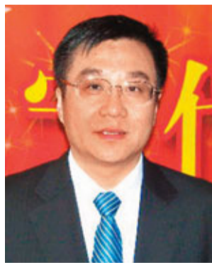
葫蘆島市長孫兆林。

「十一五」期間,葫蘆島「主題概念」產業園區從無到有,迅速發展到12個,建成和在建項目375個。規劃總面積379平方公里的各類主題概念產業園區,已成為葫蘆島對外開放的先導區和特色產業聚集區。