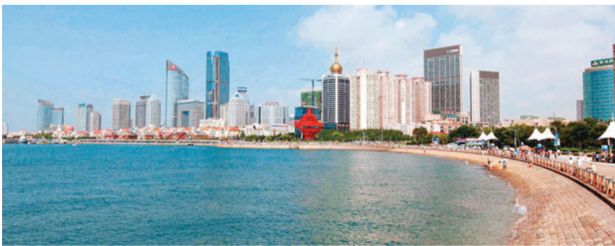
沿海美麗城市—青島市。

歷史見證了青島和香港合作的輝煌,現實昭示着我們合作的未來。香港和青島在很多方面可以南北呼應,取長補短,共同發展,實現雙贏。——夏耕