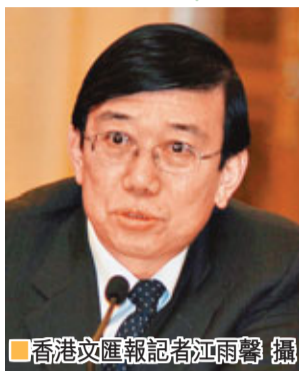
成都市委書記李春城。

李春城表示,成都歷時7年多探索和實踐的城鄉統籌、「四位一體」科學發展總體戰略,是一場貫徹落實科學發展觀的生動實踐,也很好體現了加快轉變經濟發展方式的要求,它既是黨中央、國務院和省委、省政府作出的重大改革試驗部署,也是改善民生的基礎性系統工程。