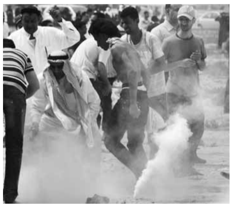
在巴林首都麥納麥，防暴警察發射催淚彈驅逐示威者。

沙特阿拉伯昨日出動逾千士兵到鄰國巴林，協助平息動亂。沙特官員稱，由於巴林政府多次要求與反對派對話，但未獲回應，遂出兵相助。巴林反對派稱，任何阿拉伯國家勢力的介入等同宣戰。