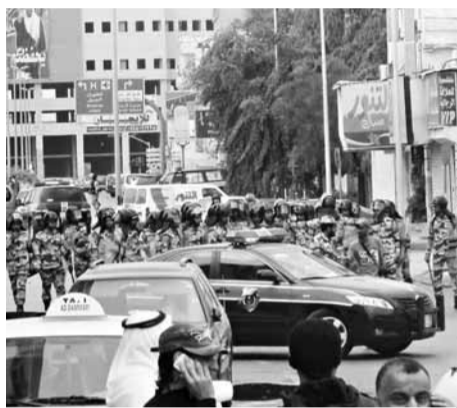
沙特國內近日爆發示威，軍人戒備防範。

巴林政府未證實軍隊入境，但沙特官員表示，海灣阿拉伯國家合作委員會(GCC)6個成員國的特種部隊，已抵達巴林。 巴林國王提出政治改革並恢復對話，但反對派堅持推翻現政權，要求長遠民主改革，否則不會返回談判桌。美國白宮促請各方克制，而英國則呼籲國民不要前往巴林。