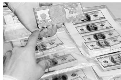
台中警方起出面值近8萬美元的百元面額假美鈔。

據中通社14日電 台灣警方14日破獲一個印製假美鈔的集團，分頭到高雄市及台中市多處執行任務，當場起出100元美鈔成品804張，查獲大型平版印刷機、凸版印刷機、模板、浮水牛油壓機等犯罪機具，還有半成品一批，並逮捕8名嫌犯。這些美鈔防偽線精良，只是浮水印方面稍有瑕疵，如果流入市面，一般民眾恐怕難以辨認。