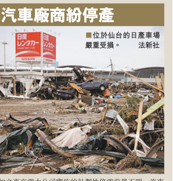
位於仙台的日產車場嚴重受損。

日本汽車廠商紛停產 豐田汽車公司昨日表示，日本國內的所有工廠將停產至明日。公司解釋稱，停產是為了優先確保災後重建和員工的人身安全。停產將導致減產4萬輛汽車。 五十鈴汽車公司也表示，所有工廠將停工至本周五。豐田集團旗下的日野汽車與大發工業亦決定停產至明日。各公司將於日後決定將來的生產計劃。 由於來自東北地區的零件供應因地震而受阻，加之東京電力公司實施的計劃性停電前景不明，汽車業界的停產有可能長期化。豐田等主要汽車廠商在日本國內的工廠昨日大多停工。某大型汽車廠商的高層表示，汽車生產線一旦啟動就難以停止，作業途中發生停電有可能引發事故。 ■共同社