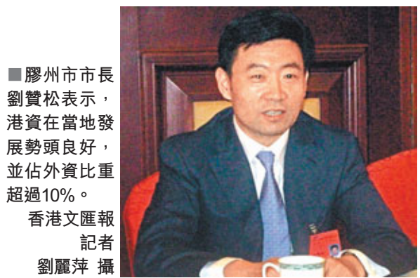
膠州市市長劉贊松表示,港資在當地發展勢頭良好,並佔外資比重超過10%。

香港文匯報訊(記者 楊奕霞、劉麗萍 青島報導)作為山東半島藍色經濟區核心區,山東省膠州市現正逐步顯示強大的吸金力。記者近日獲悉,該市僅兩個項目經已吸納港資250億元(人民幣,下同)。