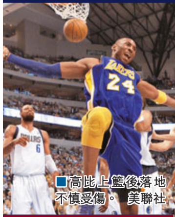
■高此上籃後落地不慎受傷。