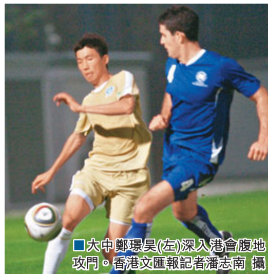
■大中鄭環吳(左)深入港會腹地攻門。