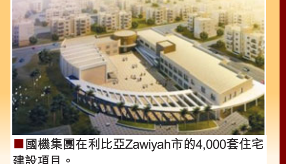
■國機集團在利比亞Zawiyah市的4,000套住宅建設項目。