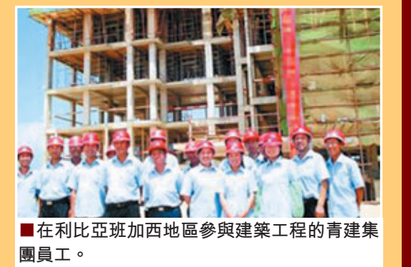
■在利比亞班加西地區參與建築工程的青建集團員工。

目前，非洲已躍居為中國第四大海外投資目的地。商務部數據顯示，截止2009年末中國在非洲投資93.3億美元，佔中國對外投資總量的3.8%，分佈在南非、尼日利亞、贊比亞、蘇丹、阿爾及利亞、埃及等49個國家，主要涉及資源開發、工程承包、基礎設施建設等多個領域。