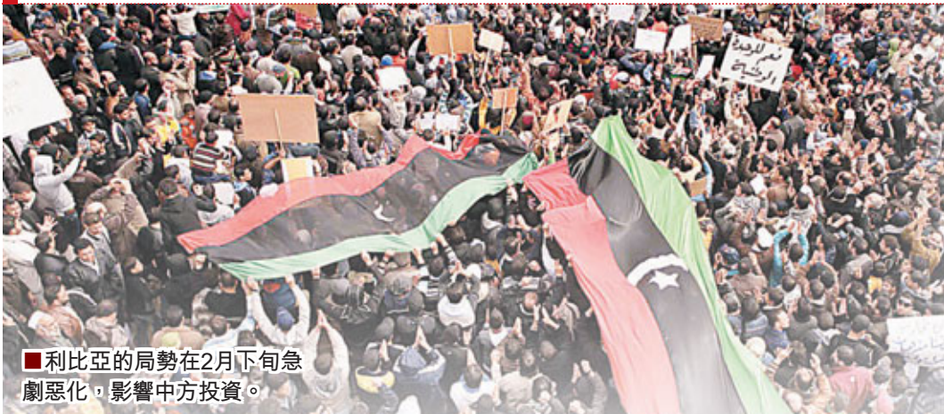
■利比亞的局勢在2月下旬急劇惡化，影響中方投資。

中國在利比亞的投資規模究竟有多大？商務部公佈中國目前有75家公司在利比亞作業，其中包括13家中央企業。據香港文匯報記者不完全统计，目前已公佈的中國在利比亞項目合同總金額逾700億人民幣。而是次動盪對中國企業造成的損失情況，目前仍是未知數，但是有關資產清點及損失工作由商務部和國資委負責，正在全面進行中，各企業也在上報損失。