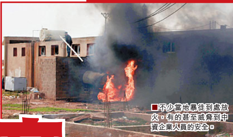
■不少當地暴徒到處放火。有的甚至威脅到中資企業人員的安全。