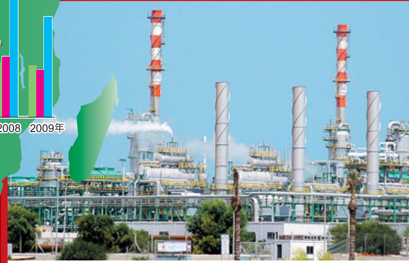
■利比亞石油設施一度成為暴徒襲擊目標。

中國建築工程總公司： 承建利比亞2萬套政府國民住宅，累計合同額約合176億元人民幣。 中國鐵路建築工程總公司： 在利比亞共有3個工程總承包項目，分別是沿海鐵路及延長線、南北鐵路和西線鐵路，合同總額42.37億美元(約280億元人民幣)。 中冶集團： 利比亞East Melita地區5,000套單元住宅和米蘇拉塔水泥廠生產線一期土建工程項目，項目合計51億元人民幣。 中國萬洲壩集團： 利比亞西部7,300套房建項目，合同金額約55.4億元人民幣。 中國水利水電建設集團： 利比亞有在建項目6個，合同總額17.88億美元(約118億元人民幣)。 中國機械工業集團： 利比亞Zawiyah市4,000套住宅建設項目，合同總金額約6億美元(約40億元人民幣)。