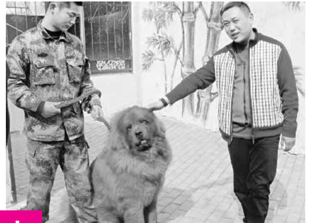
藏獒「轟動」還差幾天才滿周歲，只是一隻小獒，但牠身材粗壯，身高已經有80多厘米，身長1米多，體重達到150多斤。

香港文匯報訊 據青島新聞網13日報導，1,000萬元買條狗?!這是3月12日在青島拍出一隻名為「轟動」的藏獒價格。買家是山西晉城的商人，耗巨資買了後，只說是為了「玩玩」。據悉，由於藏獒講究血統，這使得藏獒配種變得格外不容易，找優秀品種配一次就要價30萬元，有時還要排隊預約。