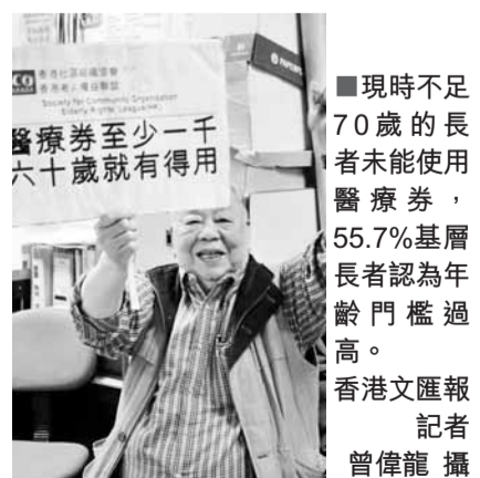
現時不足70歲的長者未能使用醫療券，55.7%基層長者認為年齡門檻過高。

協會認為，預算案建議醫療券金額增至500元，但調查發現長者使用次數增至不足3次；即使醫療券金額增至1,000元，