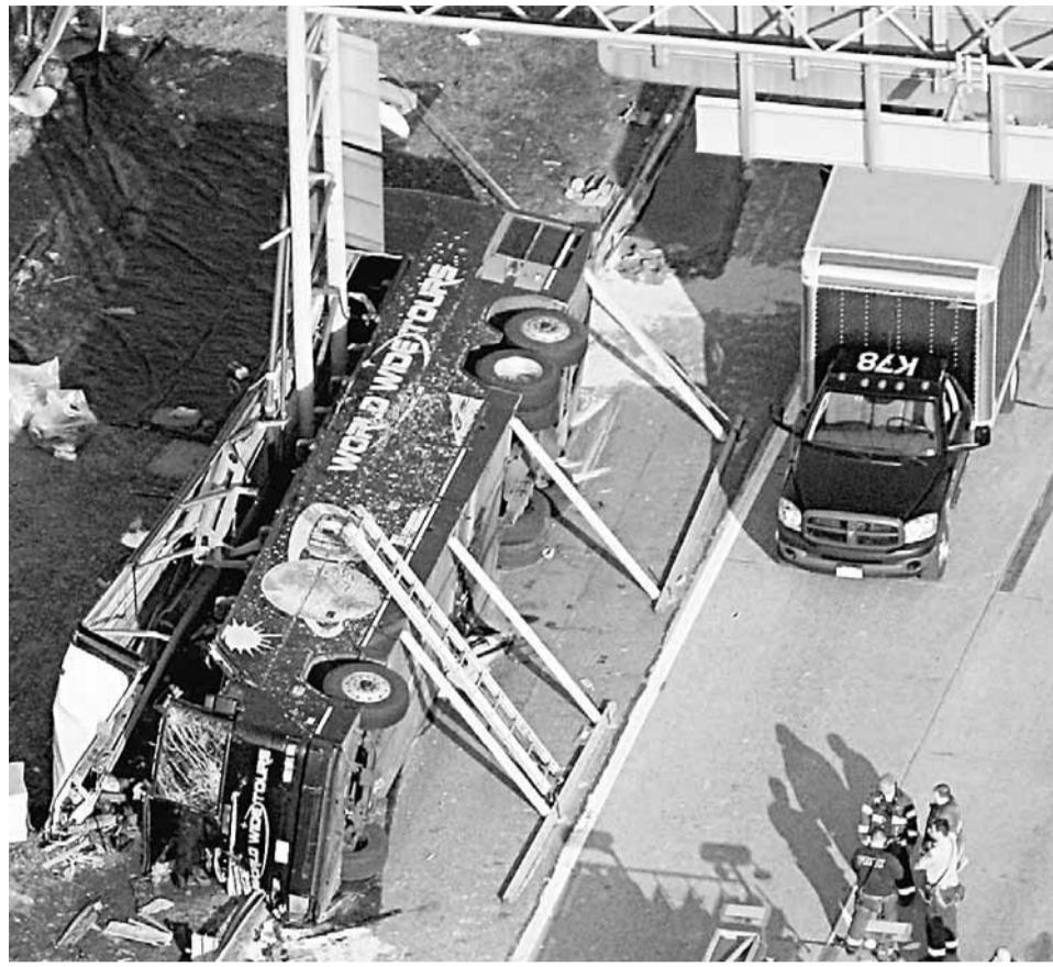
旅遊巴撞向路牌柱並翻側，車頂被割開。

美國紐約當地時間周六發生嚴重車禍，一輛載有32名乘客的長途旅遊巴士，由康涅狄格州Mohegan Sun賭場沿紐約布朗斯95號州際公路南行，駛往曼哈頓唐人街，途中撞路牌柱翻側，車頂被割開，導致15人死亡、多人重傷，當中大部分為華人。巴士司機供稱，一輛大拖車「扒頭」後，車尾刮到巴士左前部，使巴士失控，但生還者稱車禍前巴士車速甚高。