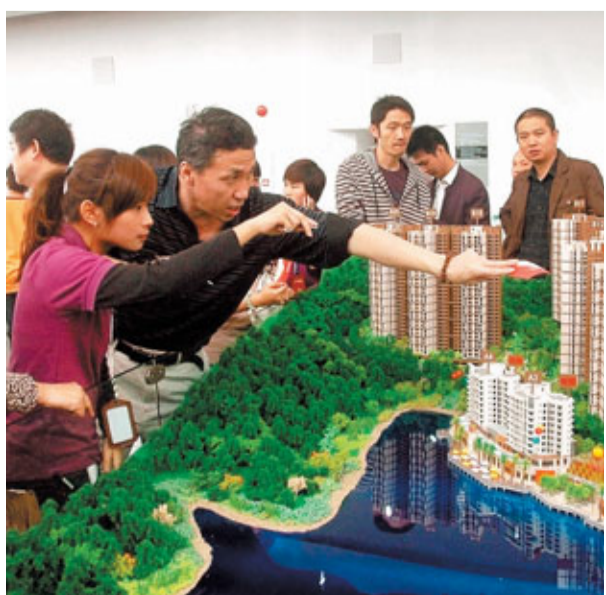
房價上漲，市民住房壓力大。

同時，網友表達了對「十二五」的願景，希望政府能在打擊貪腐方面繼續下大氣力，讓「腐敗現象更少些」。亦有網友表示：「國家應該更注重民生、關注底層弱勢群體，希望政府兌現曾經承諾的優先照顧破產或轉型後的農轉非、下崗失業工人的就業和住房問題。」