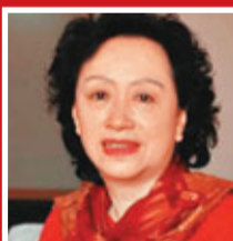
知名女作家張抗抗

對於「『十一五』尚存的最大問題」，姜昆選擇了「教育、醫療、住房等問題凸顯」和「腐敗現象」。對於執行「十二五」規劃可能遇到的最大難題，姜昆則認為是「政府改革滯後」和「社會矛盾激化」。最後，姜昆一筆一劃地寫下了自己的期待：「平衡發展，樹立良好的國際形象。」