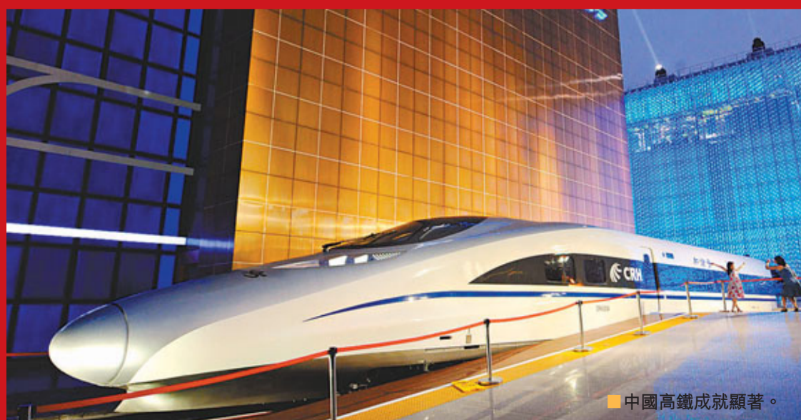
中國高鐵成就顯著。