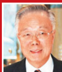
中國科學院院士楊雄里