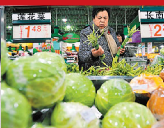
物價上漲，主婦皺眉。