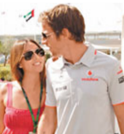
畢頓(右)與女友謝茜嘉如膠似漆。

日本日前發生有紀錄以來最強烈地震, 強度達至黎克特制8.9級, 正身處西班牙試車的麥拿命F1車手畢頓周五表示, 已與日模女友謝茜嘉取得聯絡, 對方一切安好, 未有受傷。畢頓透露發生地震時, 謝茜嘉正在東京地鐵拍照, 並說唯一只能靠Twitter與對方聯絡。畢頓與現年26歲的謝茜嘉在福井縣展開戀情, 故畢頓也特別關心日本這次天災, 並祝願所有在日本的人平安, 尤其是受災最嚴重的仙台。 ■蔡明亮