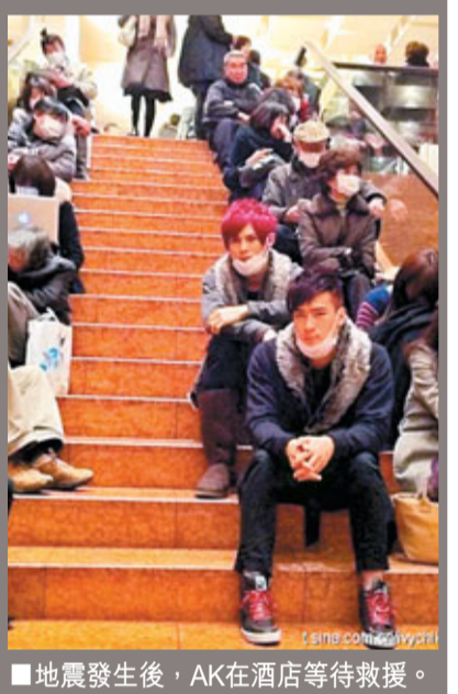
■地震發生後，AK在酒店等待救援。