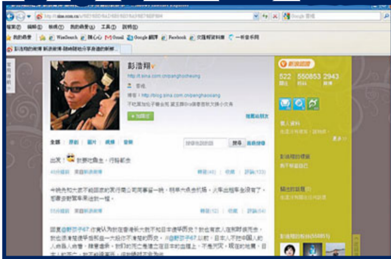
■無法離開日本的彭浩翔，決定先去食魚生醫肚。