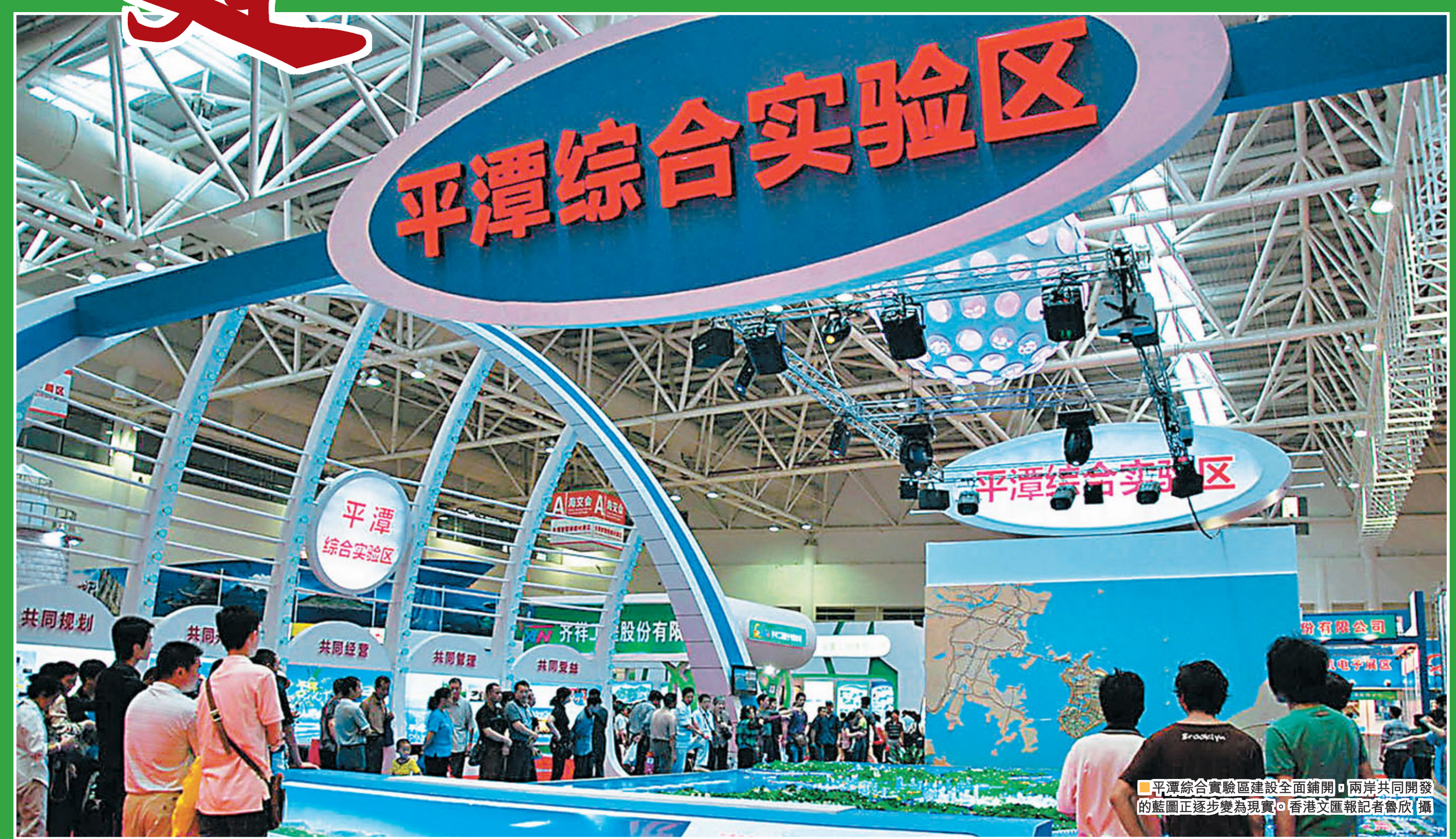
■平潭綜合實驗區建設全面鋪開，兩岸共同開發的藍圖正逐步變為現實。