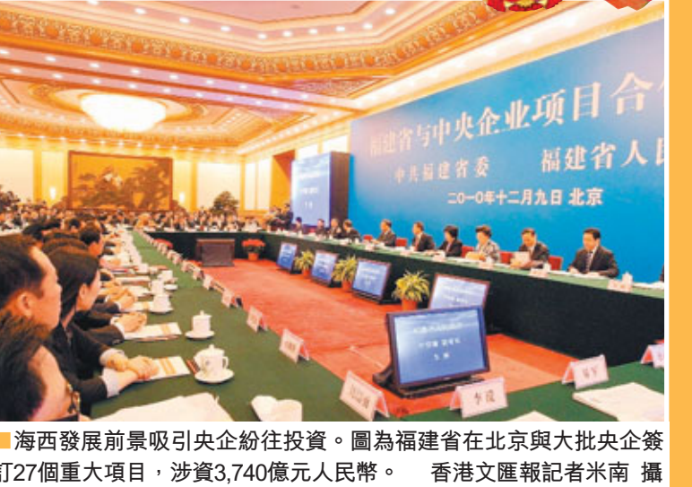
■海西發展前景吸引央企紛紛投資。圖為福建省在北京與大批央企簽訂27個重大項目，涉資3,740億元人民幣。