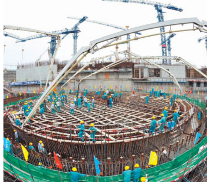
■十一五期間，福建優先佈局清潔能源。圖為工人於2010年10月在寧德核電站4號機組核島澆注混凝土。資料圖片

新年前夕，在福建漳州縣投資農業的台商收到國家主席胡錦濤的問候。胡錦濤在信中溫情回憶2010年與福建民眾共度新春佳節的美好情景，並勉勵台商與大陸同胞齊心協力，拓展市場，造福兩岸同胞。福建「十一五」最後一年，中央高層頻頻赴閩視察，成為海峽西岸經濟區建設的又一光點。