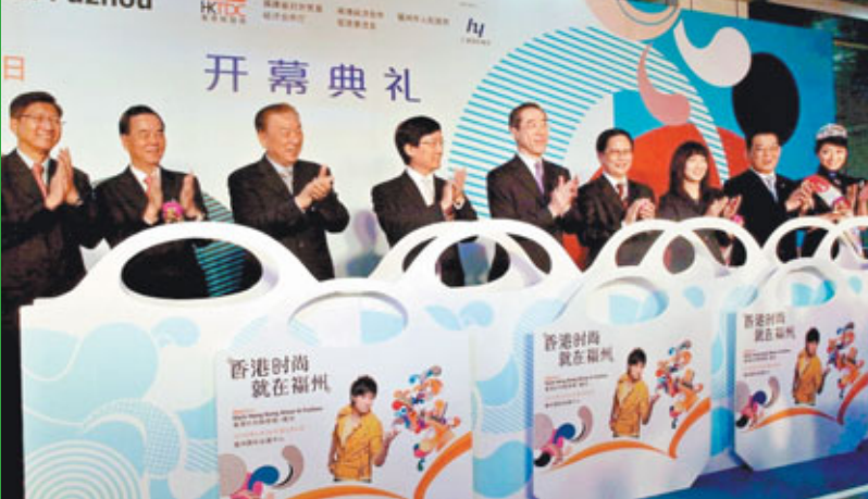
■香港特區政務司司長唐英年（左五）、福州市長蘇增添（右四）等嘉賓主禮香港時尚購物展開幕式。

福建省委書記黃小晶在福建省「兩會」上強調，港澳僑胞始終是福建各項事業發展的重要力量，新形勢下福建要密切與港澳僑胞合作，2010年實際利用港澳資金增長15.8%，閩港間貿易額增長30.8%。他稱，2010年閩港間合作取得實效，加強金融、物流等服務推介，推動閩企通過港澳進入國際採購體系、拓展葡語國家市場，又有美克國際、中駿置業等8家企業在香港成功上市，募集資金達43億元人民幣。至此，福建累計有逾60家企業在港上市。 據了解，福建今年將更加重視吸引港澳資金等生產要素，服務體系和大型企業，聯合開發兩岸四地「一起多站」旅遊線路，積極推動閩台港交流合作項目，引進香港金融機構參與兩岸貿易結算等金融服務。 港澳投資 佔閩外資近六成 據觀察，港澳資本已成為福建外向型經濟發展的重要動能，房地產、批發零售、商貿服務成為閩港服務業合作的主要領域。福建省統戰部新聞發言人李朝日前透露，截止目前，福建累計港澳投資項目達2,47萬個，合同資金877.77億美元，實際到資514.07億美元。據不完全統計，在福建的港澳投資項目數，實際到資佔福建外商投資總額近60%。