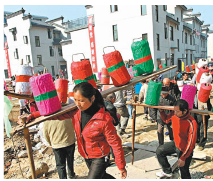
■泰寧上青鄉受災村民舉桶挑水慶祝遷新居。

此後，賈慶林主席親自參加在福建舉辦的兩岸規模最大的民間交流活動「海峽論壇」，國家副主席習近平在廈門出席第二屆世界投資論壇與第14屆中國國際投資貿易洽談會期間，還赴福建多個縣市調研，並在廈門國際郵輪中心暨廈金客運碼頭準備乘坐的台灣同胞交談，親切詢問他們在大陸的工作學習和生活等情況。 在此背景下，福建也緊緊抓住難得的歷史機遇，推進經濟跨越發展，實現民生更大改善，努力保持社會穩定，並讓3,600萬福建人民過上更加幸福安寧的生活。