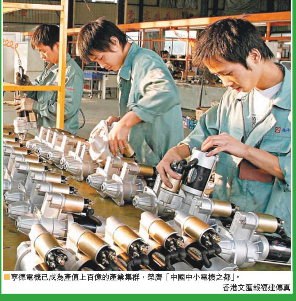
■寧德電機已成為產值上百億的產業群，榮膺「中國中小電機之都」。