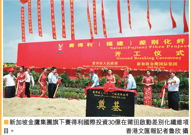
■新加坡金鷹集團旗下一寶得利國際投資30億在莆田啟動差別化纖維項目。