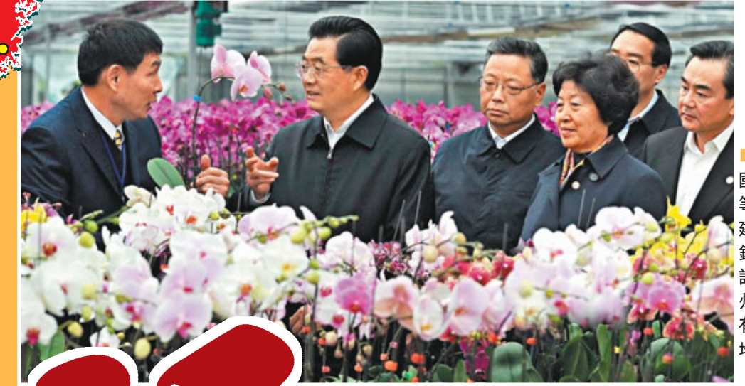
■2010年先後有國家主席胡錦濤等中央高層赴福建考察。圖為胡錦濤到台灣同胞設在創業園的漳州鉅寶生物科技基地考察。