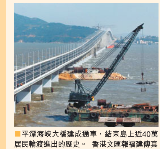
■平潭海峽大橋建成通車，結束島上近40萬居民輪渡進出的歷史。