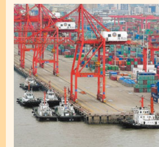
■整合後的廈門港將打造成以國際外貿集裝箱運輸為主、散雜貨為輔的國際航運樞紐港。資料圖片

據介紹，福建省2011年計劃完成交通投資750億元以上，特別在高速路一項，福建拿出510億，預計新開工16個項目，完工8個項目，以確保新增通車里程300公里，擴建150公里，建成「兩縱三橫」主骨架，實現82%的縣30分鐘上高速公路。 三大港口 加速整合 福建「十一五」期間開始的港口整合將在未來5年繼續深化推進。通過福州、廈門、泉州港三大港口的跨行政區域綜合管理，閩省預計2015年全省港口吞吐總量達3.5億噸，集裝箱1,500萬標箱，廈門、泉州港將成為2億噸港。一批具有示範效應的現代化港區建成，深水泊位200個，佔總數40%。 據統計，2010年福建交通完成投資671億元，居大陸第6位，比上年增長約30%。港口新增貨物吞吐量超3,000萬噸，集裝箱260萬噸；高速公路新增通車里程380公里，海峽西岸地區高速公路總長超2,400公里；建設改造農村公路2,850公里，港口和運輸生產持續增長，完成港口貨物吞吐3.2億噸，比增5%，其中集裝箱850萬標箱，同比增長18.7%。