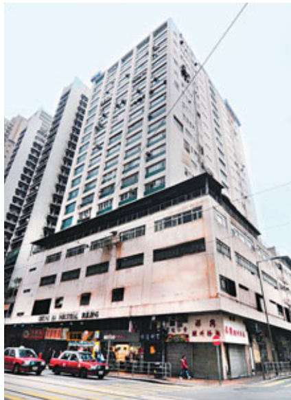
■以地價估值計，英皇統一西環長嘉工業大廈經已賬面淨賺8.4億。