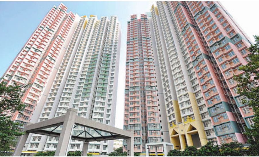
■有地產代理認為，馬鞍山錦豐苑部分單位坐擁吐露港景色，促使樓價跑贏區內部分私人住宅。

A座中層5室單位，面積約670平方呎，屬2房間隔，成交價約228萬元，折合呎價約為3,403元。買家為同區投資客，見單位間隔實用，租金回報可觀，故入市作長線