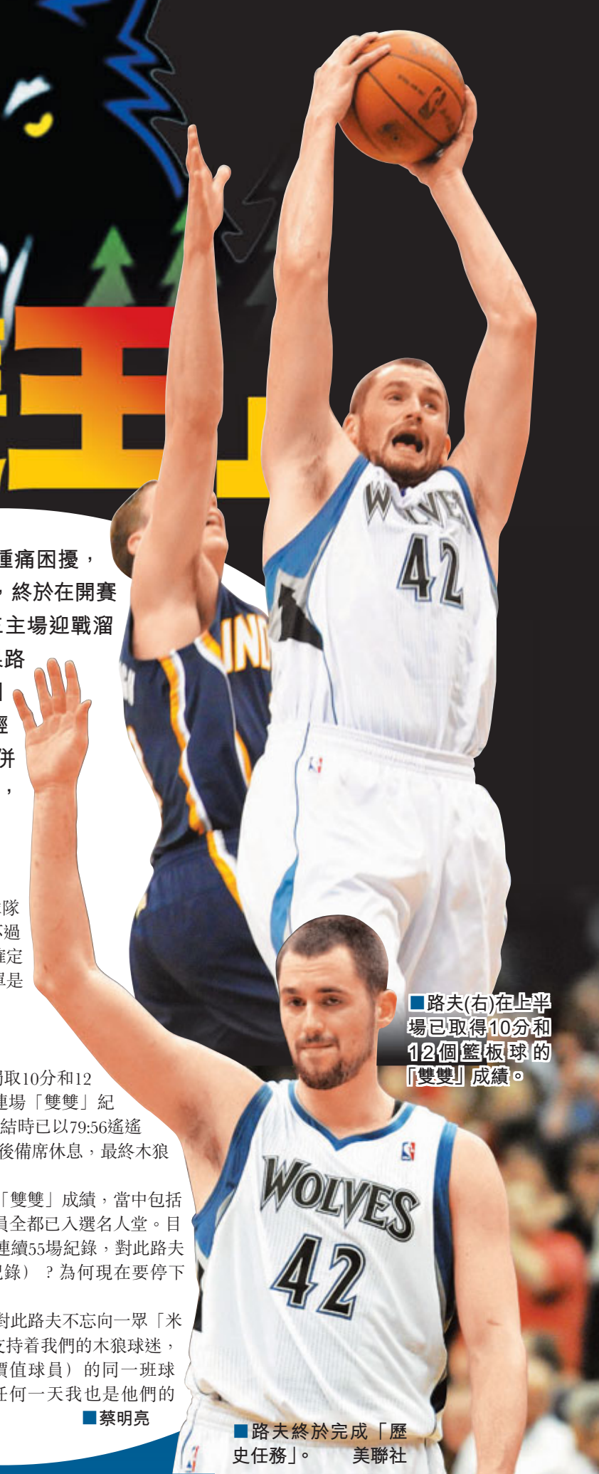
路夫(右)在上半場已取得10分和12個籃板球的「雙雙」成績。