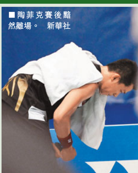
陶菲克賽後黯然離場。

與李宗偉的對決時，鮑春來輕聲說：「我就是去衝擊對手吧，畢竟他是世界頂級球員，輸球也是正常。」結果在這場大戰中，這位28歲的國手就如他賽前預測一樣，被李宗偉直落兩局21:16擊敗，次圈出局。至於另一場男單次圈賽事中，由於泰國對手坦農薩克棄賽，故國手馮龍不戰而勝闖8強。