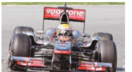
威美頓認為麥拿命戰車現階段仍未具爭標能力。

去年盡顯強勢的紅牛F1車隊，近日在西班牙試車又連番造出最快圈速，繼拿伯後，上屆總冠軍維泰爾周二造出1分21秒865的最快時間。距離新賽季展開只餘2周，未具爭標能力。但麥拿命車手威美頓已看淡車隊的爭標機會，並暗踩麥拿命車隊的戰車仍未能追得上紅牛。