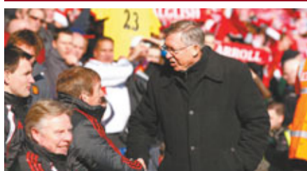
■費格遜(右)賽前與紅軍領隊握手。

英超榜首的曼聯周日聯賽以1:3不敵利物浦(紅軍)，賽後拒發言的領隊費格遜開腔，坦言已隊仗仗表現不及紅軍，「利