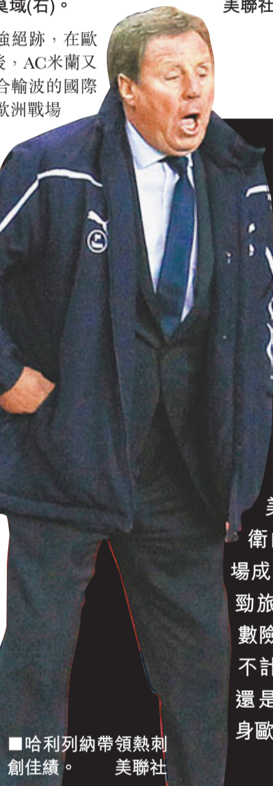
■哈利列納帶領熱刺創佳績。

另外，瑞典「殺手」伊巴謙莫域(伊巴)延續了自己在不同球隊的歐戰低迷的魔咒，22場歐聯淘汰賽只入3球，但阿帥還是鼓勵他：「伊巴表現很好，只是沒入球。」完場後落下男兒淚的老將施多夫在中場則踢出漂亮一仗，全場83次傳送72次成功，還4度搶截得手。