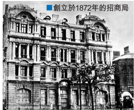
創立於1872年的招商局