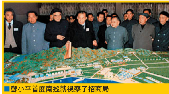
鄧小平首度南巡視察招商局

傅育寧說：「招商局未來十年的故事能不能講出新意、講得精彩，以上六個方面的創新是關鍵。如果說未來十年的發展是一篇大文章的話，那麼這六個方面的創新就是這篇文章的文眼。」