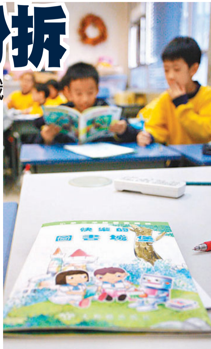
教育局昨日公布新學年正式落實課本教材分拆方案，希望出版商在成本下降下，會減低書價。