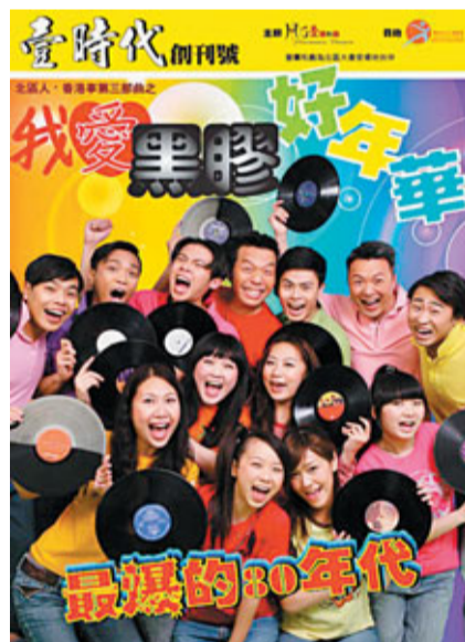
■ 《我愛黑膠好年華》海報

時間：3月18日至20日(每日)下午8時至11時 地點：北區大會堂演奏廳(香港上水龍運街2號)