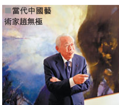
當代中國藝術家趙無極

在本月首先展出的10幅上世紀50至60年代期間，趙無極創作的繪畫傑作，其中有一半，都是過去半個世紀以來首次問世展出的罕有之作。其中