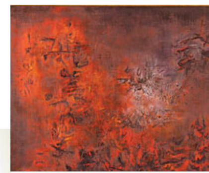
■ 趙無極的罕有之作

又以他於1958年在香港旅遊期間完成的一幅作品最為珍貴。儘管經過歲月洗禮，大部分畫作至今已不同程度破損，但畫作的絕倫價值仍瑕不掩瑜。