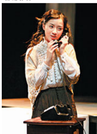
■ 紀舒參演香港演藝學院《一泊兩散偷錯情》