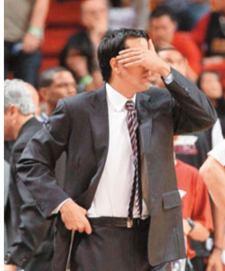
■熱火主帥斯保爾斯特拉輪到右眼睜。