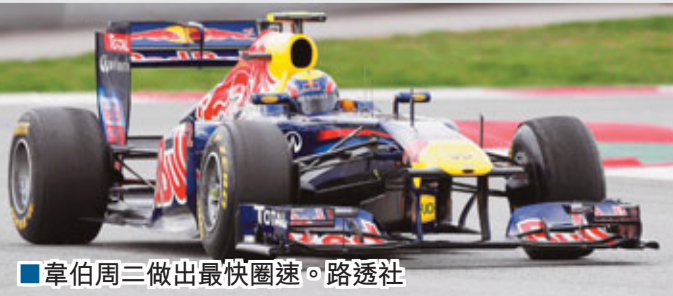
■韋伯周三做出最快圈速。