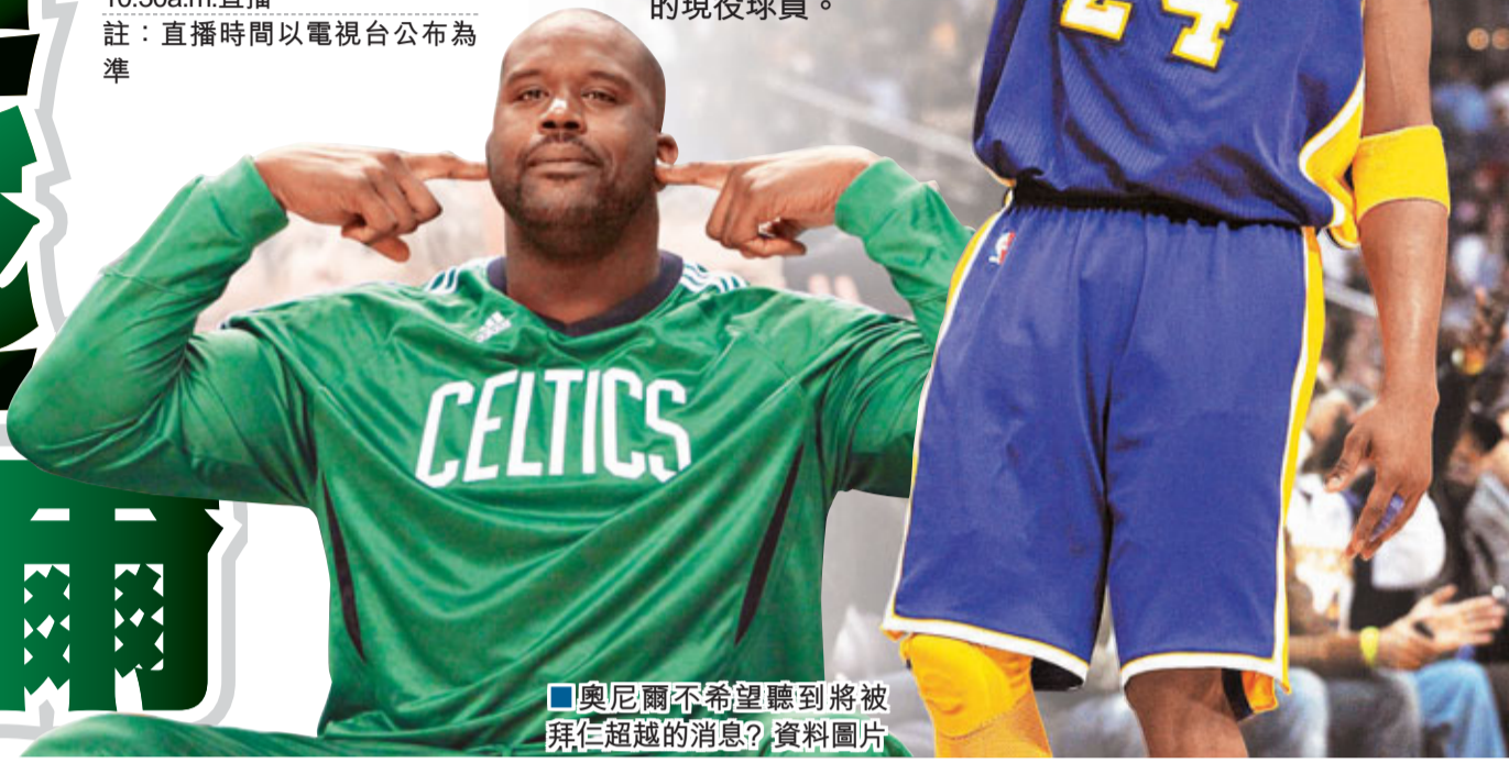
■奧尼爾不希望聽到將被拜仁超越的消息？資料圖片