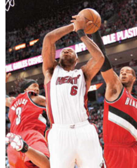
■占士(中)在2名拓荒者球員之間突破上籃。