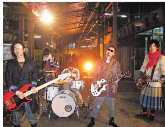
■樂隊Mr.去果欄拍MV，找來大批歌迷助陣。