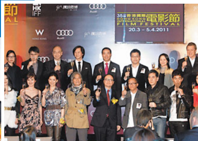
■《出軌的女人》和《報應》兩部影片在本屆「香港國際電影節」首映，昨日兩片的導演及演員均出動以壯聲勢。