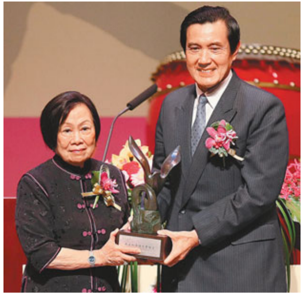
馬英九(右)追贈辜振甫「兩岸和平特殊貢獻獎」，由其遺孀辜嚴倬雲(左)代領。

據中通社9日電 台灣海基會成立20周年，9日在台北新舞台舉行慶祝大會。馬英九致詞時特別強調，身為炎黃子孫，必須想盡一切辦法謀求和平，沒有和平就沒有繁榮。大陸海協會致函祝賀，會上並追贈海基會創會董事長辜振甫「兩岸和平特殊貢獻獎」。