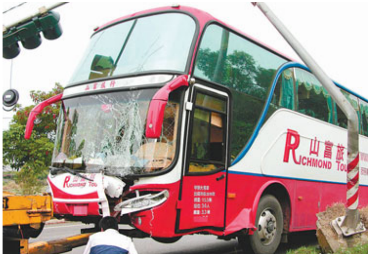
在嘉義，一輛搭載來自上海大陸客的遊覽車9日與機車發生擦撞，車上31名陸客中，8人頭部受到撞擊輕傷。摩托車司機擦傷。

另外，據稱，意外發生前約30分鐘，花蓮地區也發生一起3級地震，不排除落石意外與地震有關。