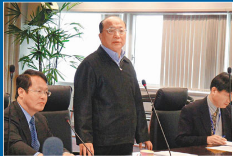
台中夜店大火奪命，市長胡志強(中)或面臨管治危機。圖為他9日召開公共安全會報臨時會。