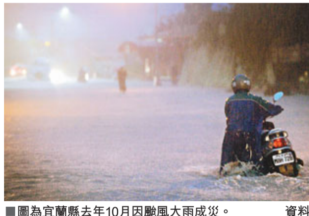
圖為宜蘭縣去年10月因颱風大雨成災。

以台北為例，新的年平均氣溫氣候值從舊的攝氏22.6度，提升到23度，其中2月及11月增加幅度較大。另外，從雨量氣候值來看，除了東南部地區減少外，其他地區都比舊的氣候值略微增加，尤其是西半部的各大都市幾乎都增加雨量約100毫米。而颱風尤其秋颱比例，也有比較多的趨勢，每年颱風的侵襲台灣數量，從每年3.1個增加到3.6個，增加率高達20%。氣象局推測與氣候暖化、太平洋高壓偏強，影響路徑有關。