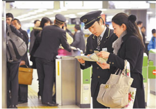
地震一度令新幹線停運，乘客向鐵路職員查詢。