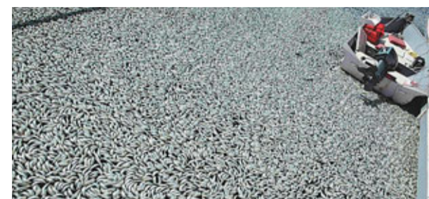
■魚屍鋪滿水面。