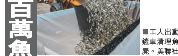
■工人出動鏟車清理魚屍。

又有大量動物離奇集體死亡事件，今次發生在美國洛杉磯南部的國王港碼頭。報道指，有工作人員前日清晨，在海上發現有上百萬條魚集體死亡，其中包括鳳尾魚、鮭魚和沙甸魚，魚屍在海面堆積成1呎厚，場面非常嚇人。