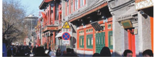
■是北京歷史視角的焦點。