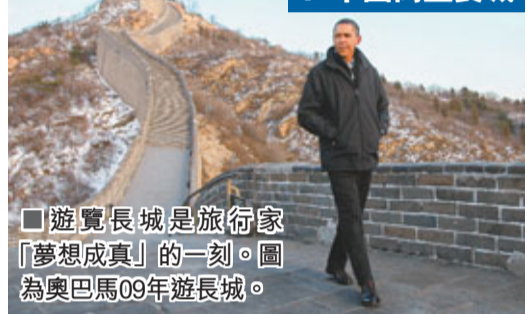
■遊覽長城是旅行家「夢想成真」的一刻。圖為奧巴馬09年遊長城。