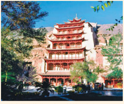
甘肅著名旅遊景點——敦煌莫高窟。

★ 能源基礎產業建設：開工建設大唐803電廠上大壓小、蘭州二熱上大壓小熱電聯產項目。新建寧縣新莊、崇信赤城、環縣甜水堡南和毛家川等礦井。建成蘭州原油儲備基地。