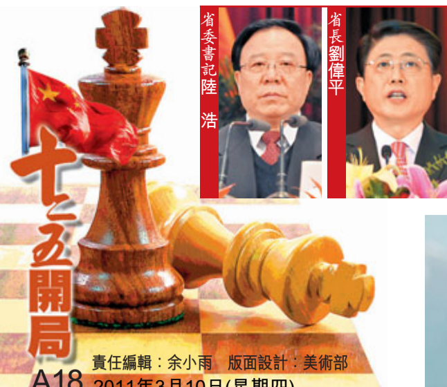
責任編輯：余小雨 版面設計：美術部 A18 2011年3月10日(星期四)