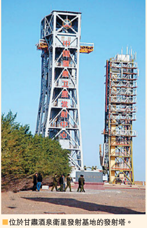
位於甘肅酒泉衛星發射基地的發射塔。

金川集團國際資源有限公司(簡稱「金川國際」)2月18日上午在香港正式成立，成功登陸香港主板市場，成為甘肅省首隻H股。中非金川投資有限公司也同時成立。 2010年底，金川集團資產總額達到660億元，位列中國企業500強第89位。金川集團已與24個國家開展了礦產資源合作，成為17家境外礦業公司的股東，完成了19個項目的投資，投資總額超過5億美元。