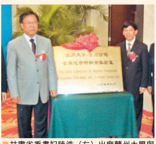
甘肅省委書記陸浩(左)出席蘭州大學與金川公司聯合成立金屬化合物實驗室。