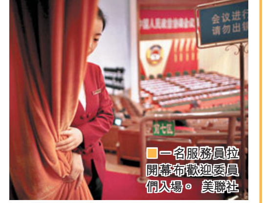
一名服務員拉開幕布歡迎委員們到場。

對此，法國專家們建言，加快培育和發展戰略性新興產業，把推動自主創新與培育戰略性新興產業結合起來，既是中國應對國際金融危機、推動產業結構優化升級的切入點，也是發揮後發優勢、實現經濟長期平穩較快發展的關鍵所在。而美國專家和媒體的一個共識是，中國要轉變經濟增長方式，調整經濟結構，以及在經濟增長的同時實現節能減排和保護環境，只有這樣才能實現可持續發展。