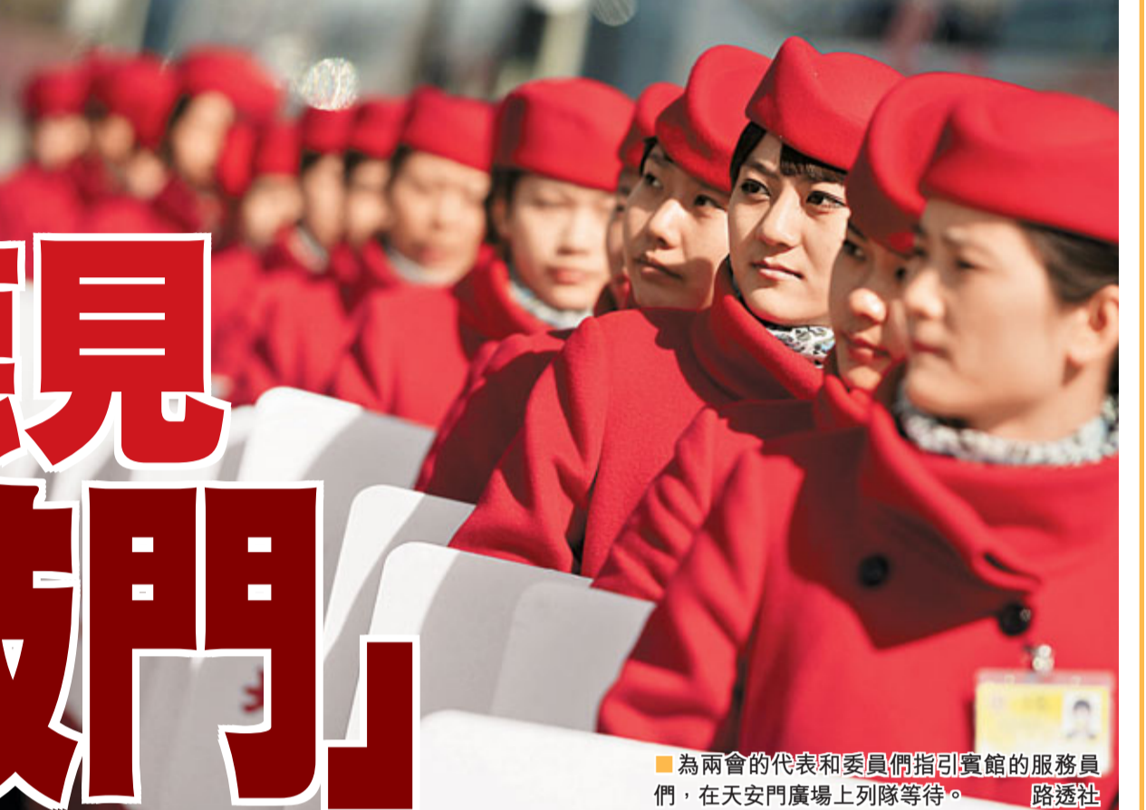
為兩會的代表和委員們指引賓館的服務員們，在天安門廣場上列隊等待。

香港文匯報訊 綜合消息：中國兩會召開期間，世界媒體關注全國政協委員和人大代表熱議的建設「幸福中國」問題，認為「讓人民更幸福」將成為中國政府未來工作的主題。