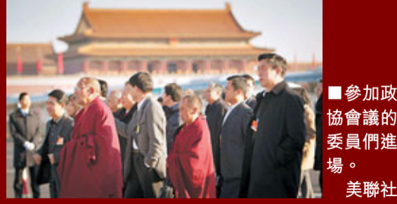
參加政協會議的委員們進場。

香港文匯報訊 (兩會記者組 葛沖 北京報導) 從去年3月十一屆全國政協三次會議至今，已經有29人被增補為全國政協委員，其中不乏剛剛卸任的省部級高官。這些風格各異的「老部長」在政協委員新崗位上，展示了各自不同的議政「新貌」。