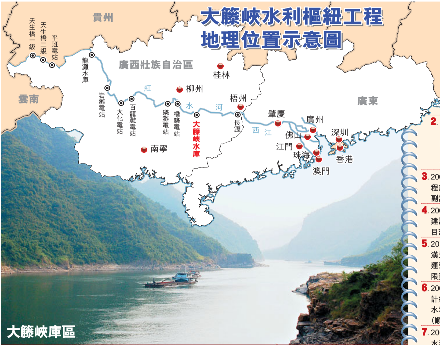
大藤峽水利樞紐工程地理位置示意圖

此外，西江流域內河航運能力也將大大提升，工程建成之後可渠化航道279公里，使2,000噸級船舶從廣州深入廣西腹地柳州、來賓等地，為打造「西江億噸黃金水道」創造條件。