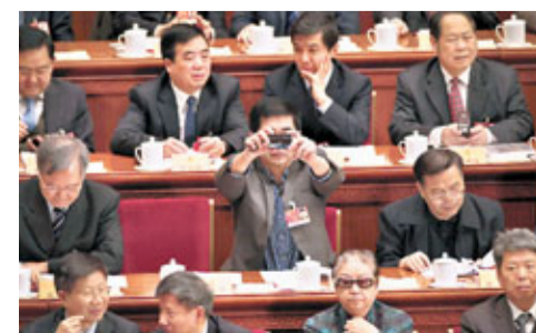
盛況存照 在昨日的政協會議上，有委員手舉相機拍下會場盛況。