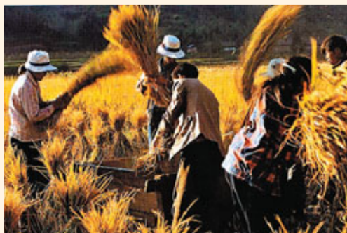
■2011年雲南要力爭實現糧食增產50萬噸。