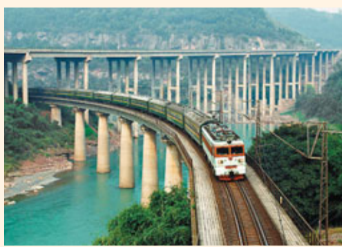
■「七小龍」之一——水富境內的內昆鐵路。