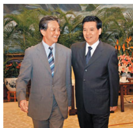
■秦光榮(右)去年7月會見蘇澤光時表示，橋頭堡背景下，加強滇港合作可實現滇港兩頭對外、陸路海路雙向互動的外向型經濟發展態勢。

樂意將資金投入在港上市的中國內地企業。去年舉行的「滇港金融合作研討會」倡議，兩地建立深化金融合作的高層次、寬領域的溝通協調機制。香港特區政府駐成都經濟貿易辦事處主任潘太平表示，港方希望為雲南的橋頭堡建設搭建一塊有力的金融跳板，推動雲南企業到香港上市和融資並走向國際市場。