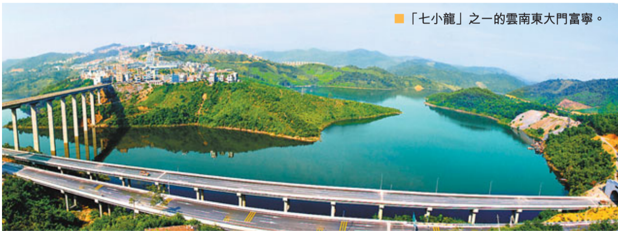
■「七小龍」之一的雲南東大門富寧。