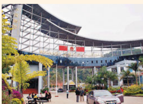
■中國通往老撾的國家一類口岸——磨憨口岸。

「以外促內」被曾赴雲南調研「橋頭堡」的國家發改委副主任杜鷹寓意為建設的關鍵點。此間有專家分析指出，雲南「七小龍」或將代表雲南一個全新的開放坐標，預示着開放型經濟體的崛起。剛剛過去的2010年，雲南配合國家46個部門組成的調研組，開展了橋頭堡建設的調研和專項文件的制定，推動橋頭堡戰略上升到國家層面；對東南亞、南亞國家開展了兩次重要訪問，產生了廣泛影響；推進了中越、中老、中緬跨境經濟合作區建設；南亞國家商品展銷順利落戶昆明，昆交會的層次進一步提高，內容更加豐富；跨境貿易人民幣結算試點取得重要進展，口岸通關項目整合成效明顯；全省外貿實現了歷史性突破，進出口總額達133.7億美元；引進外資13.3億美元，增長46%左右。「十二五」開局之際，「橋頭堡」破題，千帆競發。