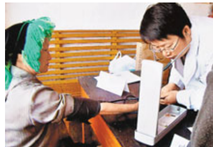
■雲南將從6個方面重點改善民生，讓更多民眾有工作，有房住，有醫看。