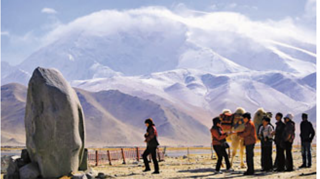
■遊客在高原珍珠——喀拉庫勒湖景區參觀。 資料圖片