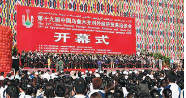
■烏洽會從2011年起升格為「中國—亞歐博覽會」後，將為新疆發展帶來巨大機遇。 資料圖片

佔祖國國土面積六分之一的新疆，是一個多民族聚居省區，人口近2,200萬，共有47個民族，其中世居民族13個。在新疆毗鄰的8個國家中，有三個國家擁有核武器，六個國家信奉伊斯蘭教，多個國家的時局有動盪。 胡錦濤總書記在中央新疆工作座談會上指出，新疆工作在黨和國家工作全局中具有特殊重要的戰略地位。新疆發展和穩定，關係全國改革發展穩定大局，關係祖國統一、民族團結、國家安全，關係中華民族偉大復興。 在2010年12月24日召開的新疆穩定工作會議上，張春賢指出，堅持中央提出的影響新疆社會穩定的主要危險是民族分裂主義的正確論斷，堅定不移地反對民族分裂、維護祖國統一和國家安全；堅持發展和穩定兩手抓、兩手都要硬；堅持「反暴力、講法制、講秩序」。 2011年，是新疆全新的民生之年，是新疆加快推進跨越式發展和長治久安的重要時期。從新疆「十二五」規劃綱要(草案)中，我們看到了新疆黨委、政府進一步改善和保障民生的決心和具體舉措，站在新的歷史起點上，新疆各族幹部群眾從容而堅定，正以昂揚的姿態和前所未有的氣度，描繪着大跨越大發展的藍圖。