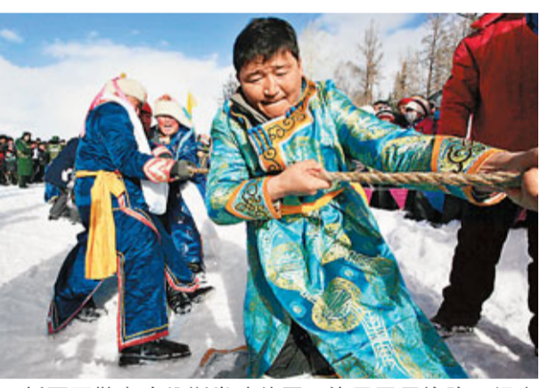
■新疆阿勒泰喀納斯當地的圖瓦族民眾用摔跤、鋸木頭、套馬頭、冰面拔河等特有的民俗活動迎接新春的到來。 資料圖片

剛剛過去的2010年，新疆工業增加值預計完成1,950億元，增長13.5%；規模以上工業企業實現利潤765億元，增長69%。推動了克拉瑪依、米東、庫車及獨山子石化工業園區建設，促進了石化下游產業集群化發展。地方工業增加值增長20.5%，佔全部工業增加值34%。49家國家和自治區級園區已成為新疆新型工業化的重要載體。 新疆已確定了加快了煤炭、石油等下游產業發展的計劃。今年的《政府工作報告》明確提出：「支持地方企業參與石油石化下游產品深加工，最大限度延伸產業鏈。」 與油氣資源相對應，新疆將全力推進煤炭資源轉化，並編制修訂伊犁、準東、庫拜、吐哈四大基地煤炭資源開發利用總體規劃。在《政府工作報告》中，新疆黨委副書記、自治區主席努爾·白克力提到把煤製氣、煤製油等作為「發展現代煤化工產業的制高點」，堅持疆電外送，推進電網電源建設，同時鼓勵推進疆煤外運。 2010年，新疆實施一攬子強農惠農政策，帶動農業增效、農民增收，全年農牧民人均純收入4,642.67元，增長19.6%，比全國平均增速快4.7個百分點，增速首次位居全