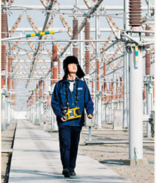
■新疆巴州750千伏變電站正式投入運行，首月運行順暢。2月9日，新疆巴州750千伏變電站的工作人員在檢查變電設備。 資料圖片