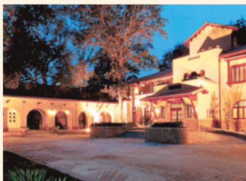
保存完好的愛新覺羅·溥儀天津舊居。