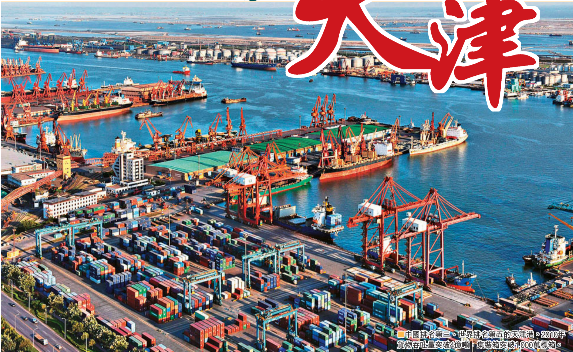
中國排名第三、世界排名第五的天津港。2010年貨物吞吐量突破4億噸，集裝箱突破1,000萬標箱。