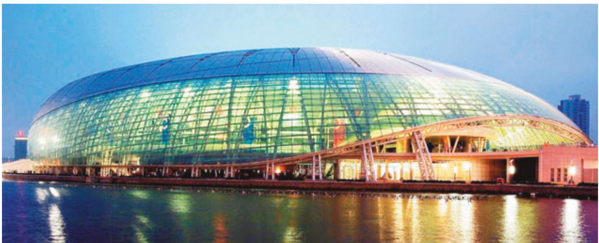
天津水滴體育館集運動、休閒、購物、娛樂、旅遊等功能於一體。