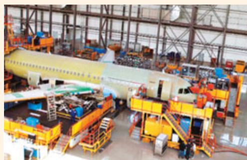
天津濱海新區空客A320飛機組裝車間。