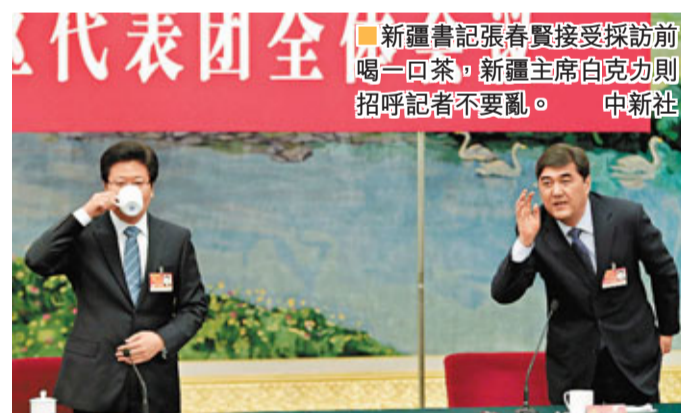
■新疆書記張春賢接受採訪前喝一口茶，新疆主席白克力則招呼記者不要亂。