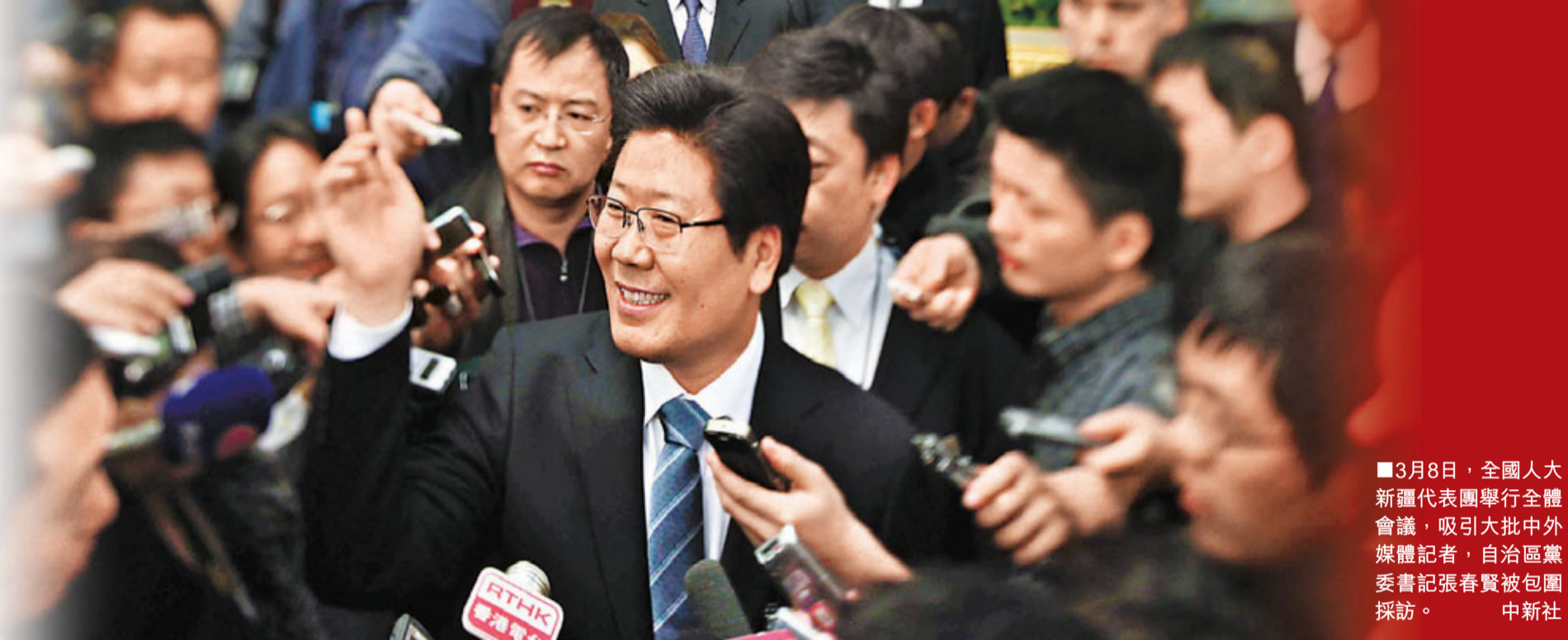
■3月8日，全國人大新疆代表團舉行全體會議，吸引大批中外媒體記者，自治區黨委書記張春賢被包圍採訪。

張春賢指出，對新疆保持社會穩定充滿信心，只有長治久安，新疆才能實現跨越式發展，才能讓各族群眾分享改革開放成果。他表示，新疆穩定的基礎仍然脆弱，個別時期穩定形勢依然嚴峻。新疆對此的具體措施可概括為「兩防」，即防止大規模群體性事件造成對社會的傷害，防止暴力恐怖事件。「對於暴力恐怖分子，要予以打擊；對於暴力事件，一律依法嚴懲。」他又強調，要吸取中東有關方面在技術層面的教訓，比如有些地方的民生未得到應有的重視，以至出現50%的失業率，高通脹、高物價等，應給我們以警示。社會不能僅採取被動措施，而應下大力氣為民服務，分享成果。