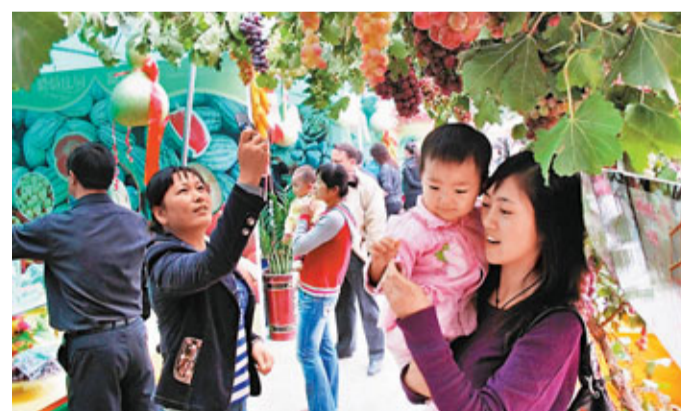
■新疆旅遊呈「井噴式」快速發展，全年收入增幅近60%。

香港文匯報訊（兩會記者組 何凡、王曉雲、趙一存 北京報道）新疆維吾爾自治區主席努爾·白克力8日在回答記者提問時表示，一年來新疆旅遊呈「井噴式」快速發展。全年國內旅遊收入增幅近60%，人氣大幅提升，呈井噴式發展，這折射出新疆大局是穩定的，新疆是安全的，能讓投資者和遊客放心。