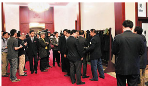
■張春賢書記去洗手間時，眾多記者守候在外等採訪。