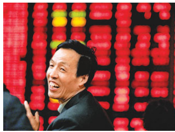
■昨日煤炭股普遍暴升,支持上證綜指全天升1.83%,收報2,996點,更一度突破3,000點關口,杭州一股民笑逐顏開。

自2011年1月25日達到的低點已經累計上漲12%。有基金經理稱,A股市場仍有繼續反彈機會。里昂證券報告指,根據2006年以來全國人民代表大會結束後的平均漲