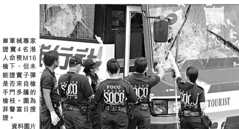
■軍械專家證實4名港人命喪M16槍下,但未能證實子彈是否來自槍手門多薩的槍枝。圖為菲警當日搜證。