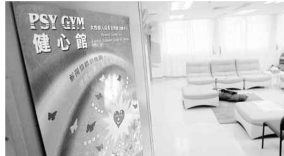
羅湖懲教所內首間本港專為女性在囚人士而設的「健心館」，今天正式啟用。

香港文匯報訊(記者 聶曉輝) 在囚人士如得到適當輔導，將大大降低他們出獄後的重犯機會。羅湖懲教所內首間本港專為有情緒、人際關係問題及重犯風險危機的女性在囚人士而設的「健心館」，今天正式啟用，將為有需要人士提供系統化的心理評估及治療，協助她們處理心理創傷，繼而重建正面的人際關係。懲教署指出，現時本港逾1,000名女囚犯中，70人經評估後需接受治療。