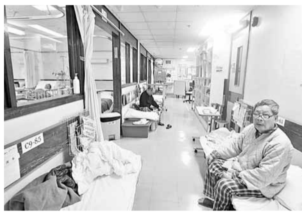
屯門醫院人手不足資源較少，男內科病房爆滿，醫生工作量「超負荷」。

過去10年醫管局醫生人手增加40%，遠超過求診人次的增長，但醫生超時工作問題嚴重，專科門診輪候時間亦愈來愈長，有聯網外科病人最長要輪候350周。梁家驊指出，公立醫院專科服務分類太仔細，專科中30%病症為內部轉介，例如病人大便出血到醫院求診，會先到大腸科再轉介肝膽胰科，但大腸專科醫生其實可同時處理肝膽胰問題，建議可開設綜合外科部門，取代部分重疊的專科。