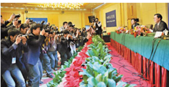
眾多攝影記者一同拍攝財政部部長謝旭人。

謝旭人表示，今年財政預算赤字將比去年減少1,500億元，佔GDP的比重進一步降低，預計會從去年的2.5%下降到2%左右。與此同時，民生方面的支出則大大增加。中央財政用於與人民群眾生活密切相關的教