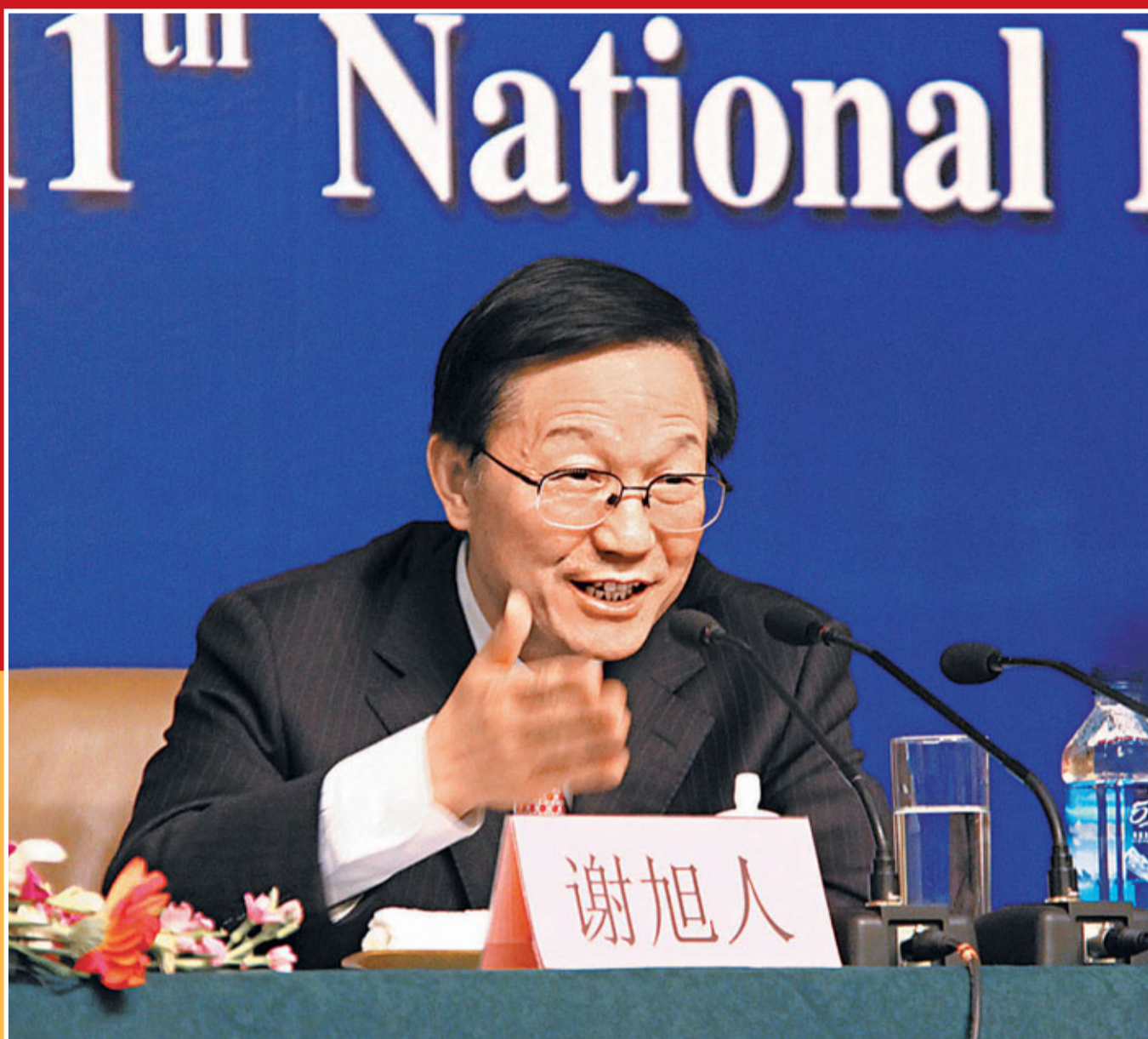
謝旭人表示，今年中央財政用於民生開支將佔中央總支出的2/3左右。

香港文匯報訊（兩會記者組 周逸 北京報道）國家財政部部長謝旭人7日在人大記者會上表示，中央財政今年用於與人民群眾生活密切相關的教育、醫療衛生、社會保障和就業、住房保障、文化方面的安排合計要達到10,510億元（人民幣，下同），民生的開支將佔到中央財政總支出的2/3左右。