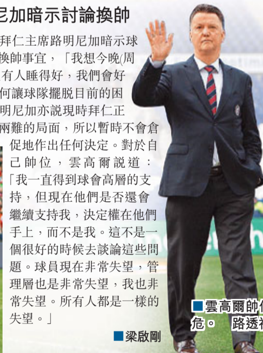
雲高爾帥位危。