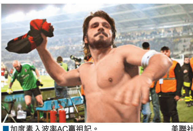
加度素入波率AC贏祖記。

意大利甲組足球聯賽，AC米蘭周末作客1:0擊敗祖雲達斯。加度素下半場中段建功，取得個人超過3年以來首個入球，協助AC取勝。AC得61分繼續排榜首，祖雲達斯得41分排第7。