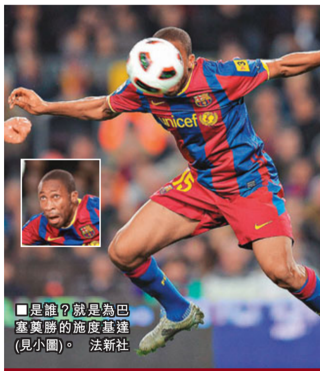
是誰？就是為巴塞奠勝的施度基達(見小圖)。