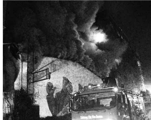
■火場冒出陣陣濃煙，部分顧客逃生不及，造成9死12傷慘劇。

台北市政府獲知後，即要求相關局處針對市內酒吧、舞廳等大型聚會場所全面安檢，同時也加強推動「台北市火災預防自治條例」草案的三讀，全面禁止在台北市內特定場所使用明火表演，以避免類似不幸事件的發生。