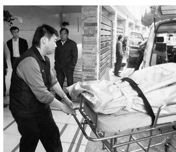
■罹難者遺體陸續送到台中殯儀館，由家屬辨認及檢察官相驗。