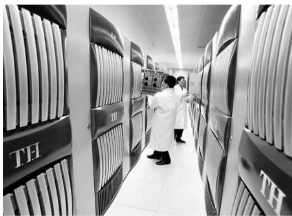
國防科技大學研製的「天河一號」超級電腦。

當前運算速度最快的大容量大型電腦運算能力相當於17.5萬台筆記本電腦，可迅速模擬複雜程序，所以能在基因測序、核爆試驗、石油勘探等眾多領域大顯身手。CPU是電腦的核心部件，長期以來，超級電腦最大的難點就是製造「超高性能CPU」。