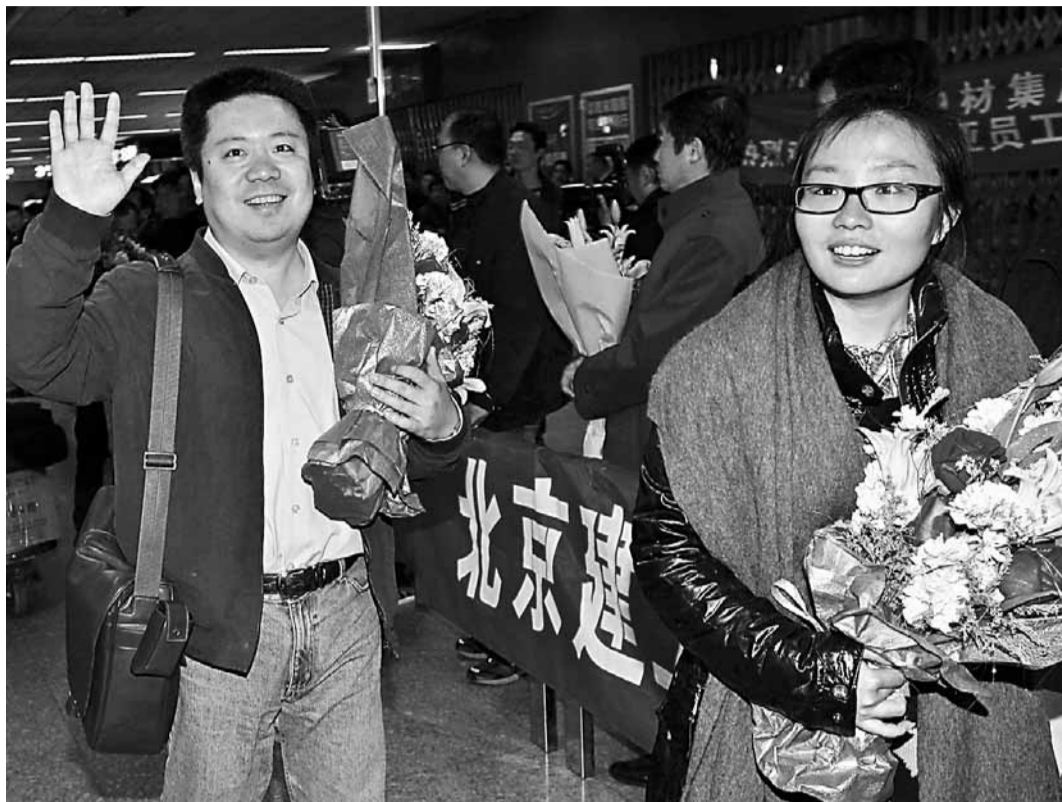
隨着中國政府調派出的上海航空公司包機FM608航班抵達上海虹橋機場，中國撤離在利比亞人員行動圓滿結束。

郭少春說，以人為本、生命至上，以及血濃於水的同胞之情，讓各方工作人員晝夜連轉，攻克