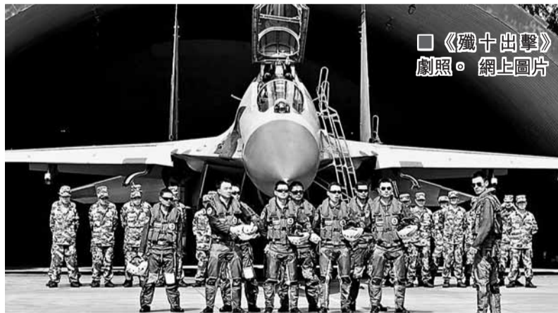
國防科技大學研製的「天河一號」超級電腦。