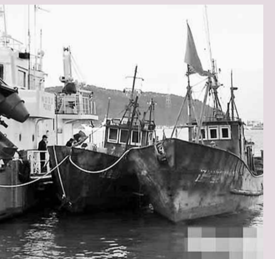
被韓國海警檢舉的中國漁船。

香港文匯報訊 據韓聯社報導：韓國泰安海岸警署6日繼續調查兩艘中國漁船，指他們在韓國海域非法捕撈。調查主要針對9名船員(另有1名因中槍受傷正在住院治療)向韓國海警施暴的程度，以及非法捕撈的前後經過。另外，對於施暴人員中的一兩名主要鬧事者，將於明天內以違反特殊公務執行罪申請拘捕令。韓國海警還將對非法作業的中國漁船處以3,000萬韓圓(約21萬港幣)罰款。