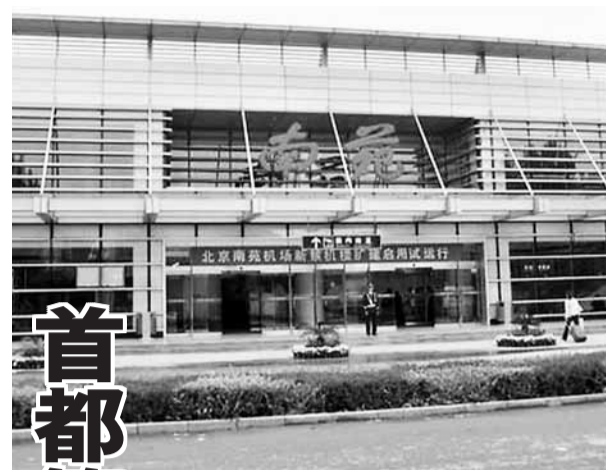
北京南苑機場是北京地區第一座軍民兩用的大型機場。