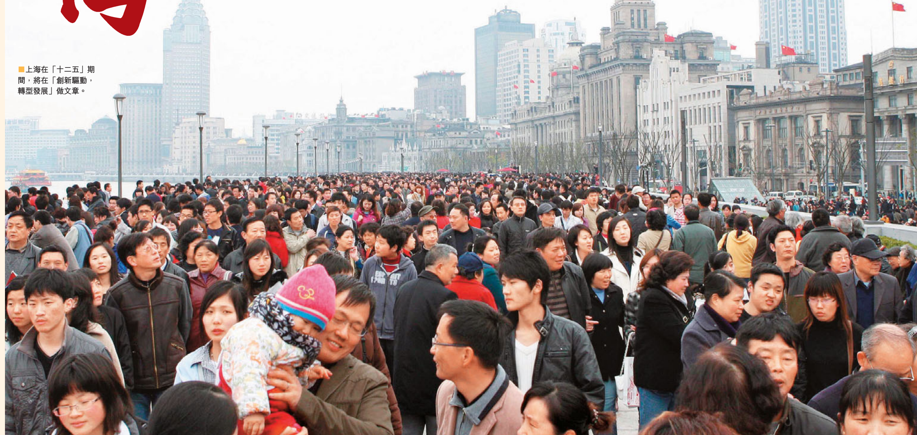
■上海在「十二五」期間，將在「創新驅動、轉型發展」做文章。